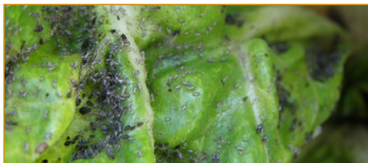
Pulgón en acelga

Para su control, también es importante limitar los excesos de vigor del cultivo para no facilitar su multiplicación, así como favorecer la instalación de insectos beneficiosos.