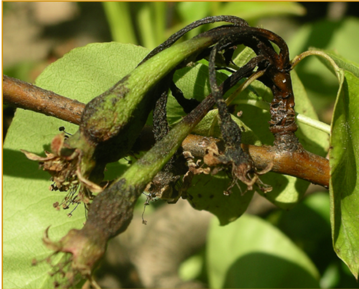
Fuego bacteriano en peras recién cuajadas

Una técnica efectiva en la lucha contra esta plaga es el uso de la confusión sexual, incluso en parcelas de menor tamaño que las necesarias para otras plagas. Los productos autorizados para este uso son ISONET Z* (Biogard) y ZEUTEC* (SEDQ). Los difusores deben colocarse a principios del mes de mayo, antes de la salida de las larvas.