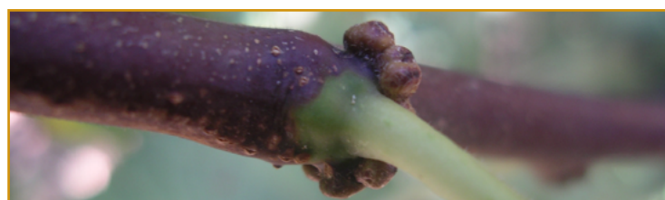
Síntomas de acalitus en rama joven

El síntoma más característico de la presencia de este eriófito, es la aparición de unas pequeñas agallas o abultamientos de aproximadamente 2 mm de diámetro en la base de las yemas del ciruelo. Como consecuencia de ello, se produce una reducción en el crecimiento de los brotes. En caso de observar estos síntomas se deben realizar cada 10 días, aplicaciones de azufre* , hasta finales del mes de mayo.