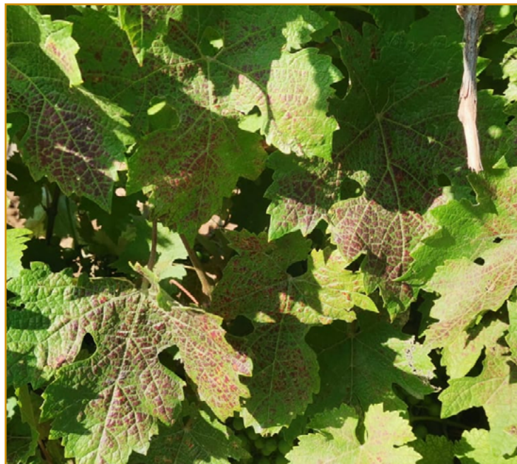
Hojas con daños por araña amarilla en variedad tinta

En aquellas parcelas que durante la pasada campaña tuvieron un ataque fuerte de araña amarilla, se debe controlar la población desde el inicio y solo en caso de apreciar daños , se recomienda realizar un tratamiento entre los estados fenológicos de F. Racimos visibles a G. Racimos separados.