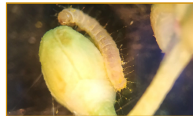
Larva de prays en botón floral (generación antófaga)

de frutos afectados. El tratamiento suele coincidir cuando el fruto tiene un tamaño entre pimienta-guisante. Los daños de esta generación no se aprecian hasta septiembre, cuando la larva sale de la aceituna haciéndola caer, con la consiguiente pérdida de cosecha; es la llamada esporga de San Miguel.