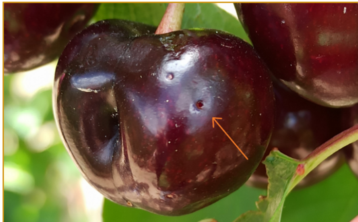
Orificio de salida de la mosca de la cereza

Con una meteorología normal, en las comarcas más tempranas de Aragón suele comenzar el vuelo de los adultos de esta plaga, a mediados del mes de abril. En las parcelas en las que se detecte la plaga o la hayan sufrido en campañas anteriores, es recomendable realizar tratamientos semanales para su control desde el momento en que las cerezas tomen su color del amarillo al rojo con alguno de los siguientes