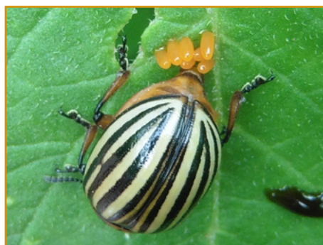
Puesta de escarabajo de la patata

Es importante rotar materias activas para prevenir posibles resistencias.