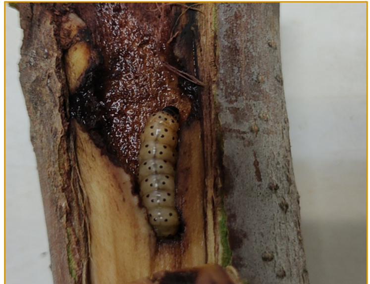
Larva de zeuzera