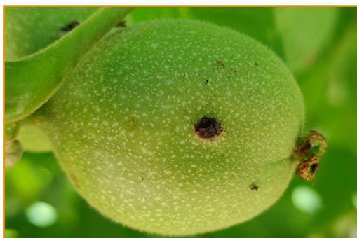
Carpocapsa en una nuez

Esta plaga, que también afecta a los frutales de pepita, puede ocasionar graves pérdidas en la cosecha del nogal. Desde mediados de mayo pueden comenzar a observarse daños en las nueces. El síntoma habitual es la salida de excrementos al exterior,