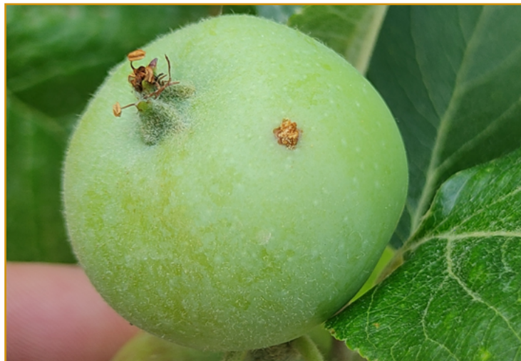
Daño reciente de carpocapsa en manzana