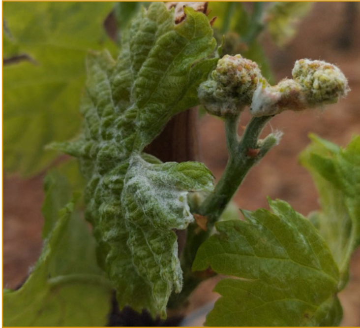
Brote con oídio.

Extremar las precauciones en aquellas parcelas que el año anterior tuvieron problemas o en variedades más sensibles.