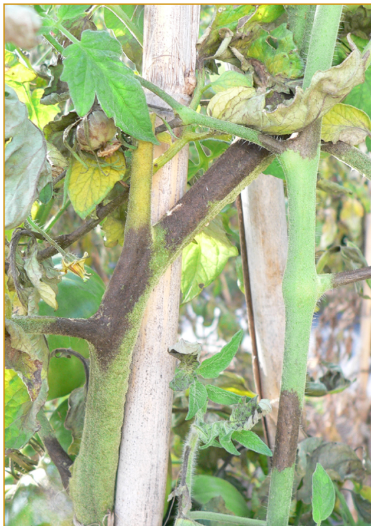
Mildiu en tomate

Muchas de estas materias activas se presentan también en mezclas autorizadas para cada cultivo, por lo que, antes del uso de cualquier producto, se debe consultar el Registro de Productos Fitosanitarios del Ministerio de Agricultura, Pesca y Alimentación, para comprobar que está autorizado para el cultivo y la plaga a controlar.