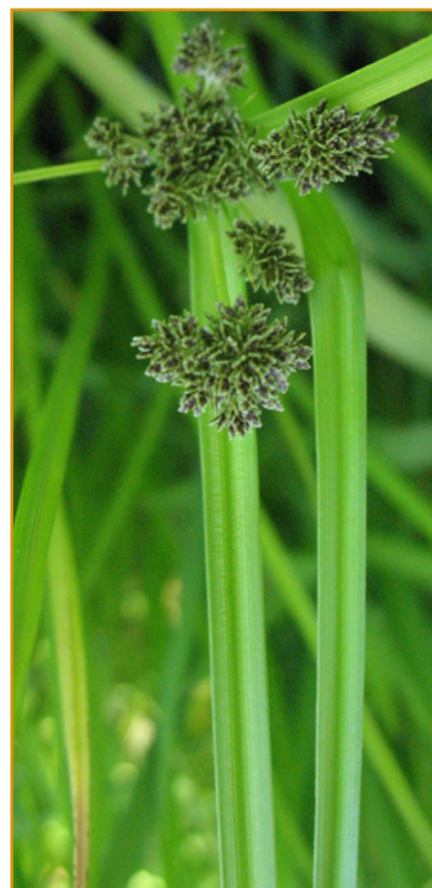
Detalles de las inflorescencias de Schoenoplectus supinus (= Scirpus mucronatus ), Bolboschoenus maritimus (= Scirpus maritimus ) y Cyperus difformis .