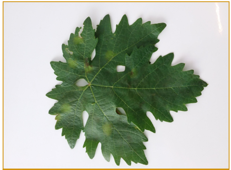
Manchas de aceite en hoja

La sequía de esta campaña no ha favorecido el desarrollo del hongo. Si llueve y se dan las condiciones adecuadas, habrá que tener protegido el periodo más sensible para la viña, que es el comprendido entre floración y grano guisante. La recomendación en caso de darse esta situación y/o de que se vean los primeros síntomas (manchas de aceite en hoja), es realizar un tratamiento con un fungicida sistémico antes de la floración.