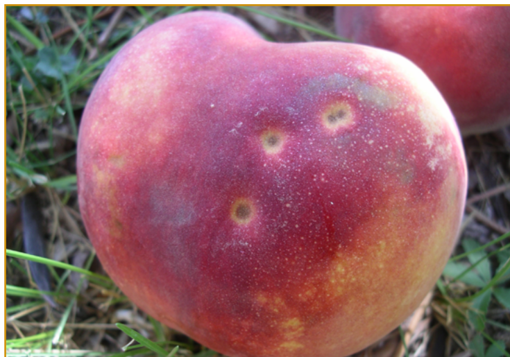
Daños de roya en melocotón

Si durante el final de la primavera y el verano se dan lluvias persistentes y temperaturas suaves y en aquellas parcelas que hayan sufrido daños de esta enfermedad en años anteriores, sería conveniente realizar aplicaciones preventivas con boscalida + piraclostrobin 26,7%+6,7%WG (SIGNUM FR-BASF, plazo de seguridad de 3 días) en ciruelo y con difenoconazol 25%EC (varios, plazo de seguridad de 28 días) en almendro. Para el resto de las especies sensibles a roya no existen materias activas autorizadas. Sin embargo, fungicidas autorizados contra otras enfermedades en estos cultivos pueden presentar cierto efecto sobre ella.