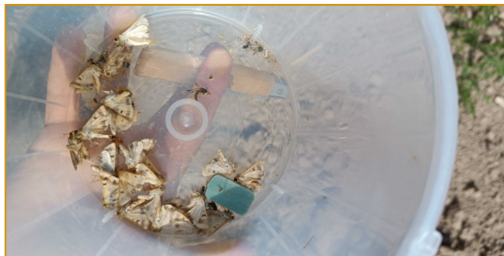
Trampa con adultos de Helicoverpa

Es importante la detección de los primeros vuelos con trampas de feromonas sexuales específicas.