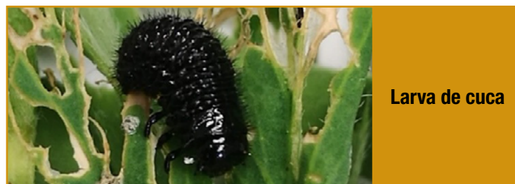
Larva de cuca

La fase más agresiva es la de estado larvario debido a su gran voracidad pueden defoliar las plantas de la alfalfa. Los daños ocasionados por los adultos no suelen ser de consideración.