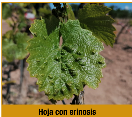
Hoja con erinosis

No son visibles a simple vista. La raza de las falsas agallas es la más extendida en España, y origina unas llamativas agallas en las hojas, con abullonamiento hacia el haz. Raramente afecta al racimo. Suele preferir variedades sin pelo en el envés como la Garnacha.