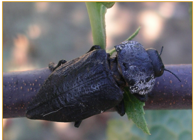
Adulto de gusano cabezudo en ciruelo

Aunque las parcelas con riego deficitario, abandonadas o en secano son más propensas a sufrir esta plaga, aquellas que cuenten con riego establecido, pueden plantearse la aplicación de nemátodos entomopatógenos*.