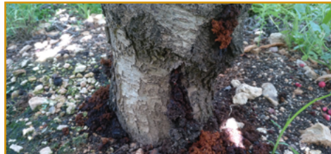
Daños de cossus en cerezo

En caso de tener presencia de esta plaga en las plantaciones, la forma de controlarla es la aplicación en la entrada de las galerías que produce en los diferentes frutales (en tronco, cuello y base de las ramas principales) de alguno de los piretroides autorizados cada 14 días desde la primera quincena del mes de mayo hasta finales de agosto.