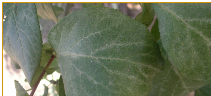
Hojas de ciruelo atacadas por araña amarilla

Los eriófidos, ácaros de menor tamaño, pueden producir los mismos daños que las especies anteriores cuando presentan altas poblaciones. Además de los productos empleados en el control de ácaros, también se puede luchar contra ellos empleando compuestos a base de azufre*.