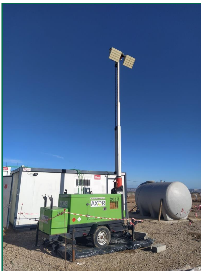
Fotografía 9. Grupo electrógeno.