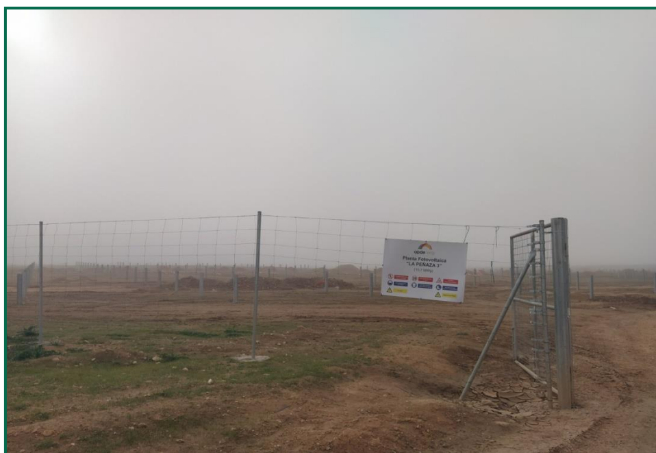
Fotografía 2. Vallado.