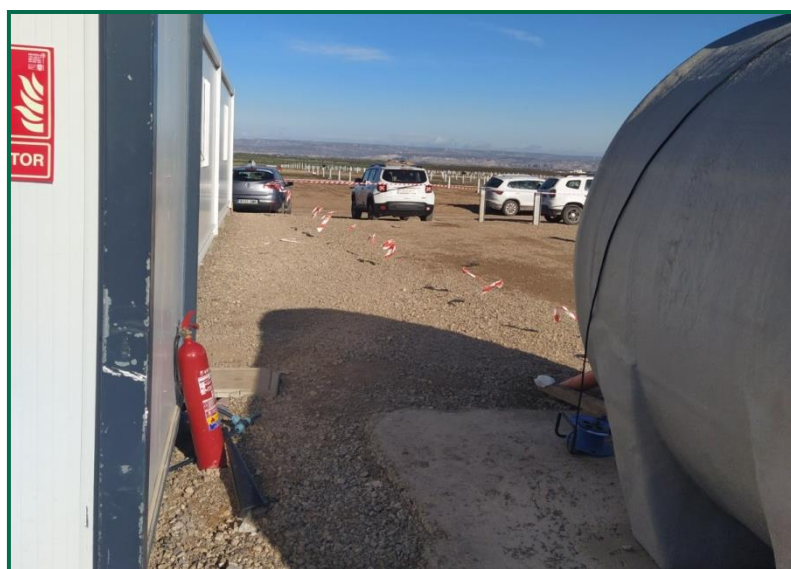
Fotografía 11. Extintor junto a grupo electrógeno.