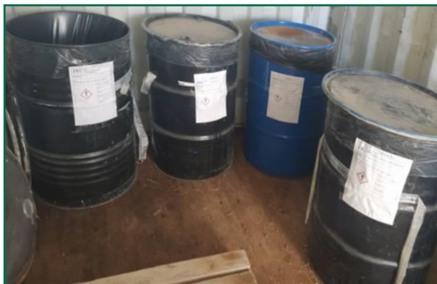
Fotografía 6. Bidones para residuos peligrosos.

Los residuos peligrosos, se almacenan en bidones específicos, cerrados y almacenados en el interior de un contenedor metálico tipo marítimo. Actualmente se dispone de 5 contenedores, cada uno de ellos etiquetado, para los siguientes residuos: Aerosoles, Tierra y piedras contaminadas, envases metálicos contaminados y envases de plástico contaminados.