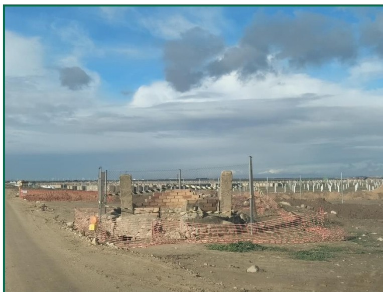
Fotografía 12. Muella de carga