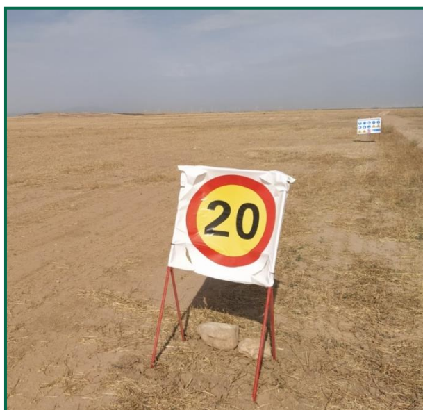
Fotografía 3. Señal de limitación de velocidad.