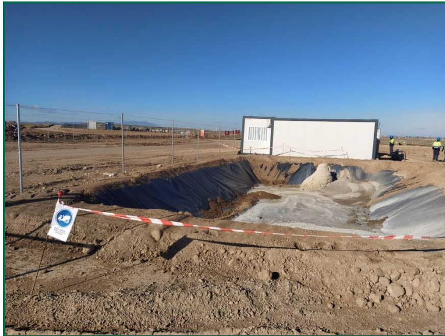
Fotografía 7. Zona de lavado de hormigón.

Se han instalado baños en dos de las casetas, con una fosa séptica estanca enterrada, y un depósito de agua.