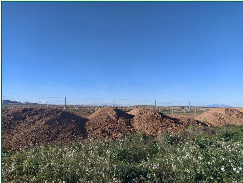
Fotografía 4. Acopio de tierra.