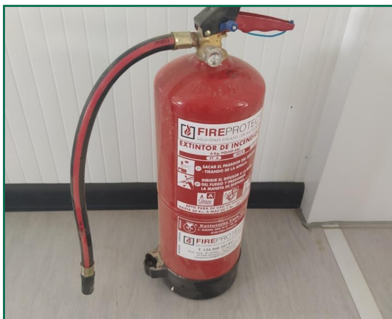
Fotografía 10. Extintor.