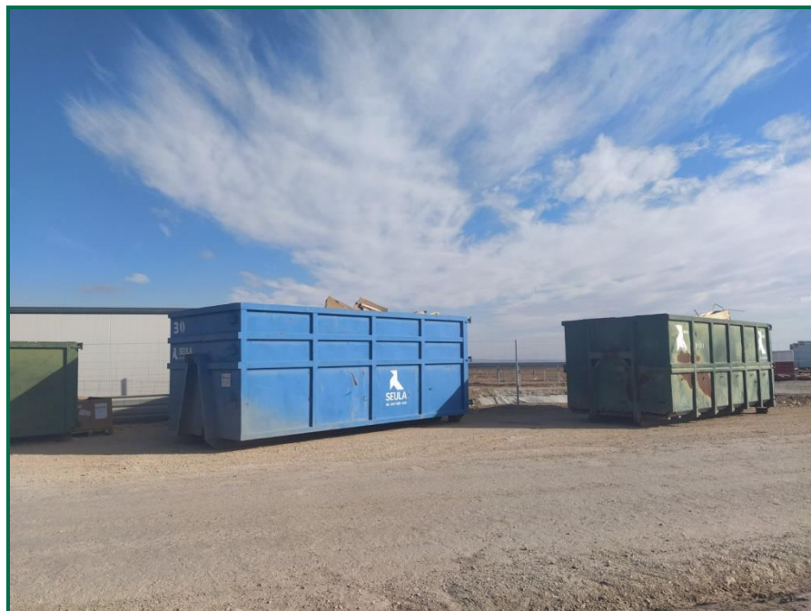
Fotografía 8. Contenedores para voluminosos.

El grupo electrógeno en uso cuenta con chasis estanco y se ha colocado un plástico para evitar vertidos accidentales en la recarga de combustible.