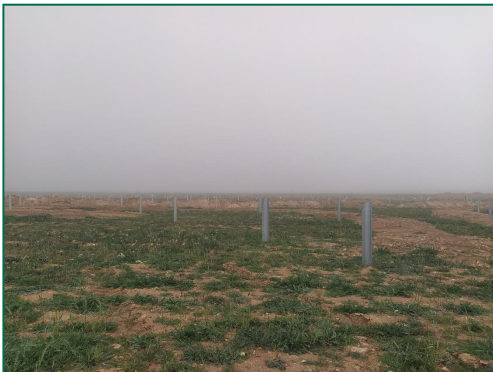
Fotografía 5. Hincas sobre el terreno.