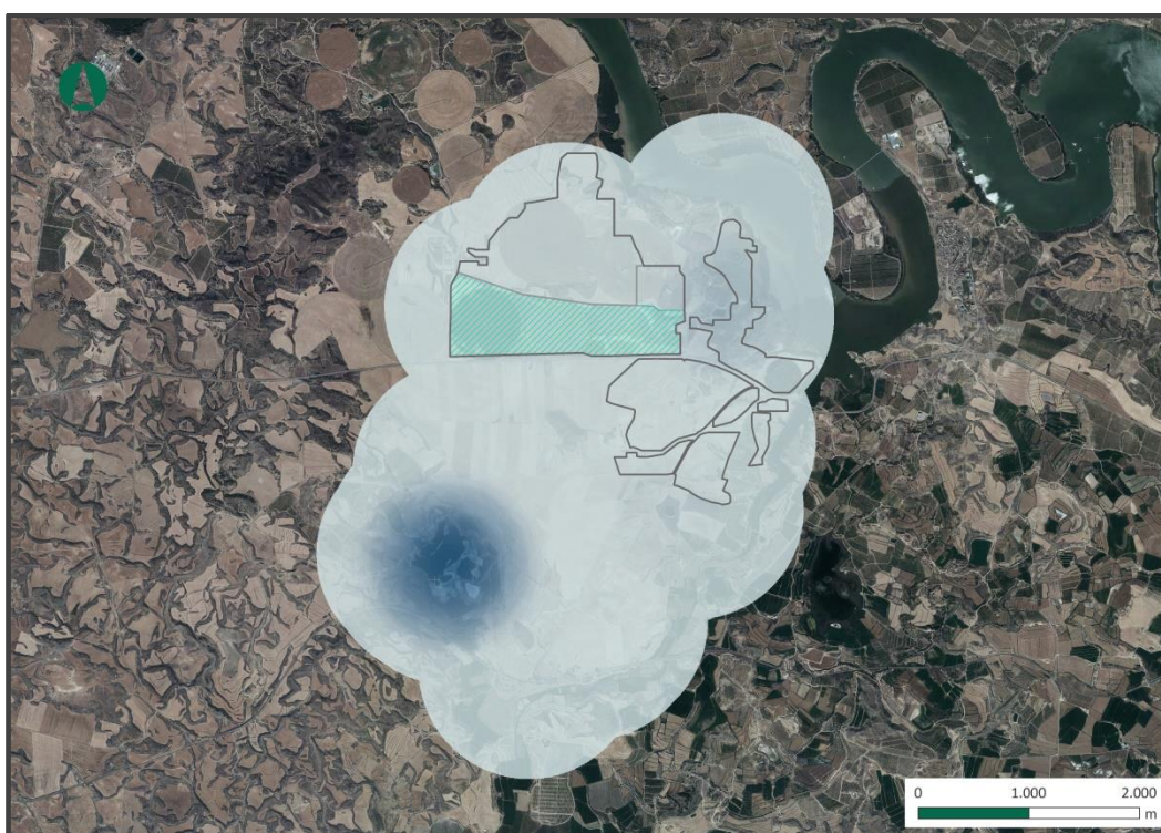
Figura 1. Uso del espacio por aves de mayor envergadura.

Los resultados se pueden ver en la siguiente figura, donde se representa el uso del espacio de todas aves de gran envergadura, incluyendo aves acuáticas, muy abundantes en la zona debido a la gran cantidad de láminas de agua presentes, sin embargo son y las aves rapaces y córvidos las que realizan mayor cantidad de desplazamientos y vuelos de prospección. Estas rapaces también suelen sobrevolar las láminas de agua, donde tienen mayor disponibilidad de presas potenciales.