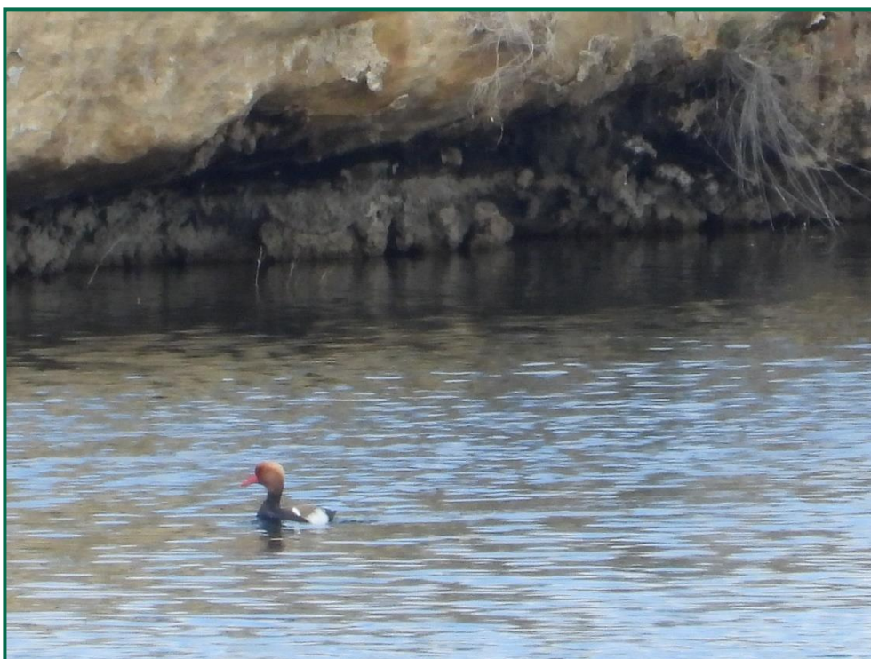
Fotografía 13. Pato colorado.