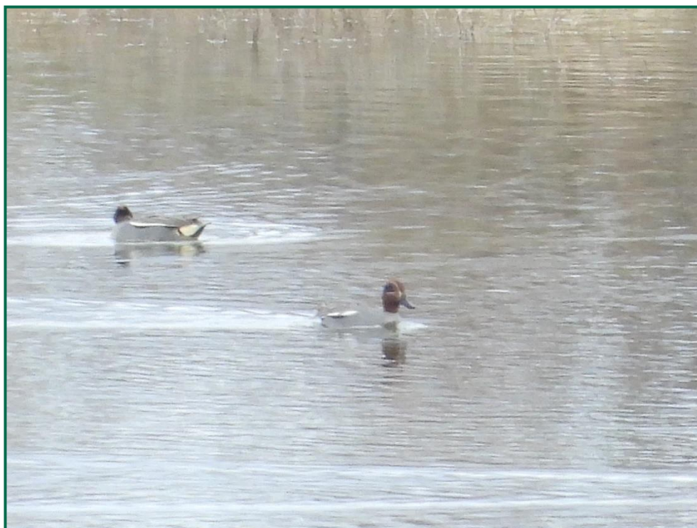
Fotografía 12. Cercetas en las Saladas.