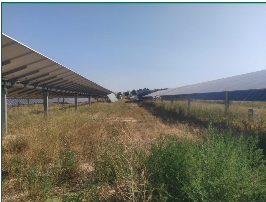
Fotografía 1. Vegetación entre placas actualmente.

En el periodo que abarca este informe no se han realizado podas mecánicas, se ha introducido ganado ovino en todas las plantas solares con objeto de recortar esta vegetación, a la vez que aportan nutrientes al suelo. No se han utilizado herbicidas.