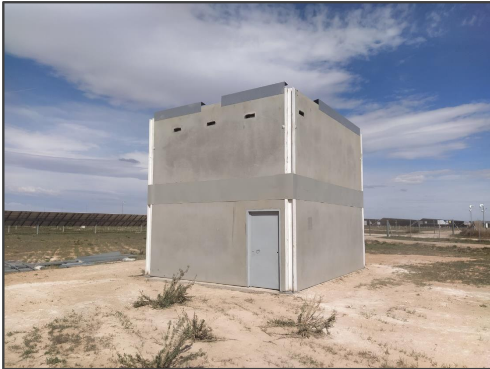
Fotografía 14. Exterior del primillar de nueva construcción.