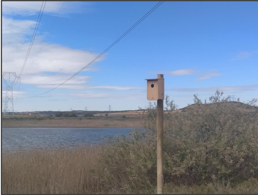
Fotografía 19. Caja para carraca junto a Hoya de Blase.