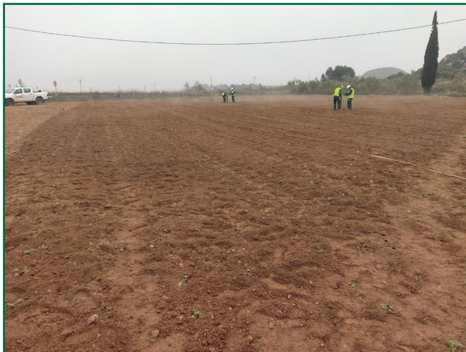
Fotografía 2. Proceso de plantación.