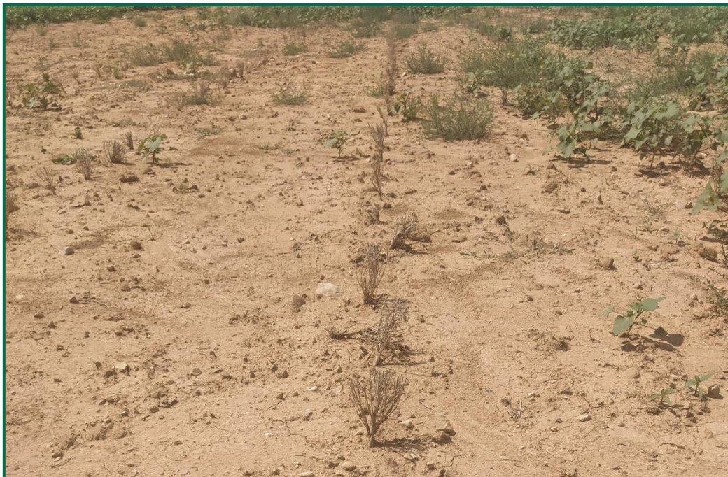
Fotografía 7. Detalle de las plantas de tomillo.