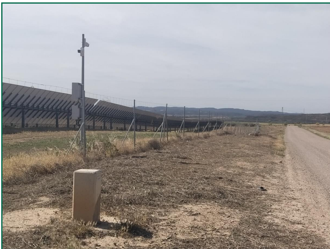
Fotografía 10. Vallado perimetral.

Con objeto de realizar un seguimiento de fauna en explotación se han realizado las siguientes acciones: