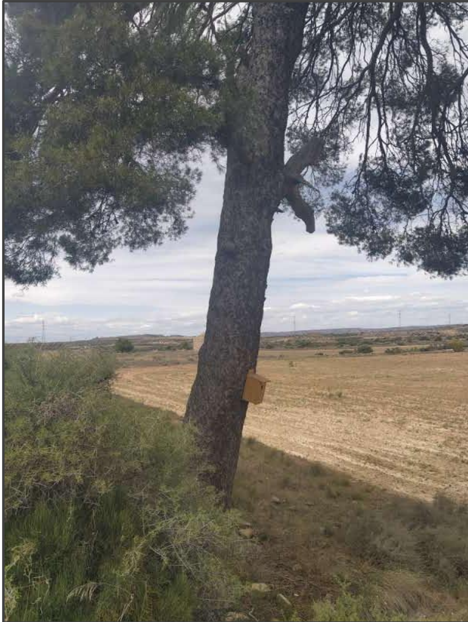
Fotografía 18. Caja para carraca sobre árbol.