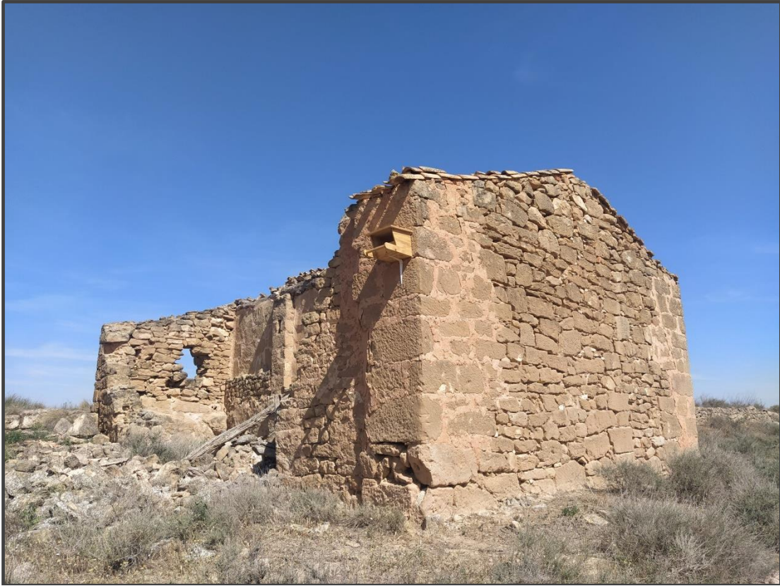
Fotografía 17. Caja para rapaz sobre construcción.