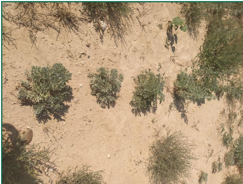
Fotografía 5. Detalle de las plantas.