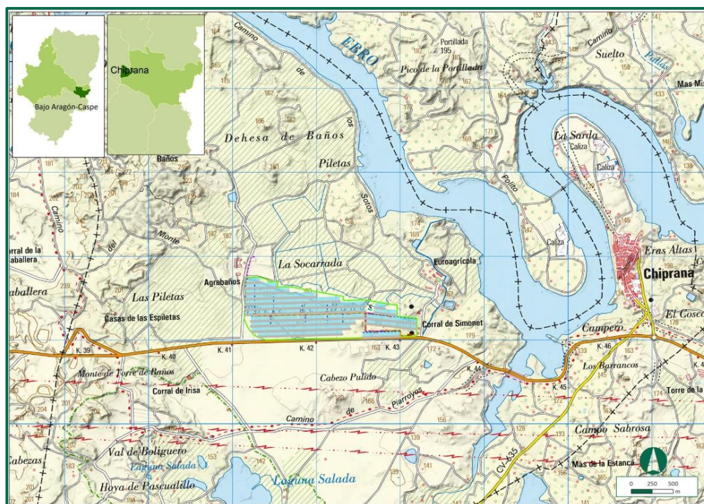
Figura 1. Localización de la PFV.

La totalidad de la instalación FV se encuentra incluida en la hoja escala 1:50.000 nº 442 “Caspe” del Mapa Topográfico del Servicio Geográfico del Ejército, y en la cuadrícula UTM 10 x10 km 30TYL37.