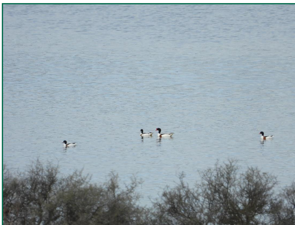
Fotografía 11. Tarros blancos en las Saladas.