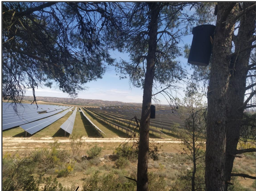
Fotografía 20. Cajas para quirópteros.