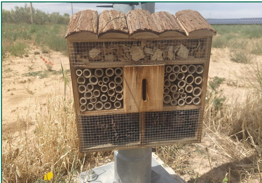
Fotografía 8. Hotel para insectos.