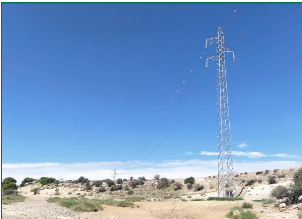
Fotografía 9. Línea eléctrica con balizas salvapájaros

Respecto al vallado perimetral, se ha utilizado malla cinética que permite el paso de fauna de pequeño tamaño. Este vallado mide 2 metros de altura total y está formado por una serie de alambres verticales y horizontales, con una separación entre los verticales de 30cm, y entre los horizontales de mínimo 15cm en la línea inferior. En la planta fotovoltaica, esta malla está colocada dejando 15 cm libres desde el suelo al primer alambre. Se trata de un vallado con permeabilidad para la fauna, no presenta elementos cortantes ni punzantes.