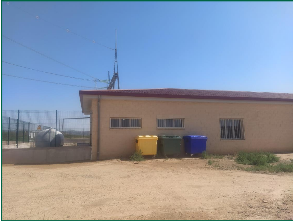
Fotografía 22. Contenedores de residuos no peligrosos en exterior de la subestación.