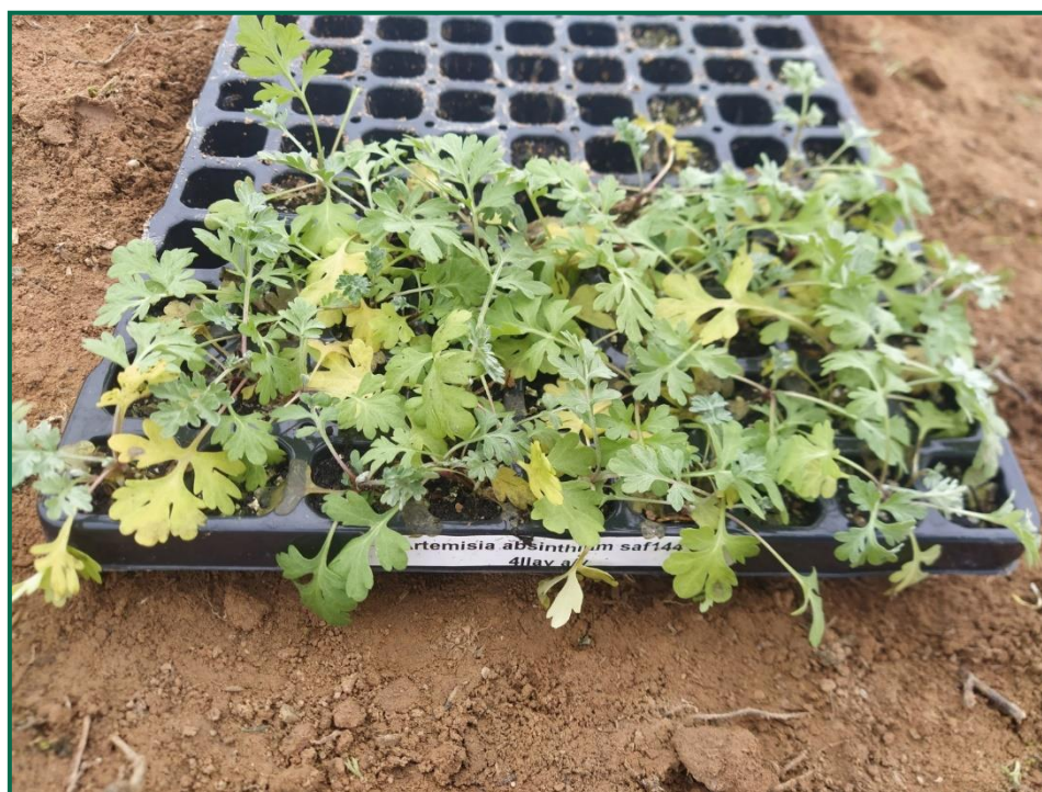
Fotografía 3. Detalle de las plantas.