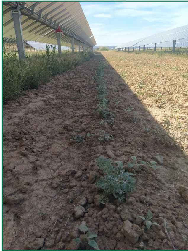
Fotografía 6. Detalle de las plantas de artemisa entre seguidores en la actualidad.