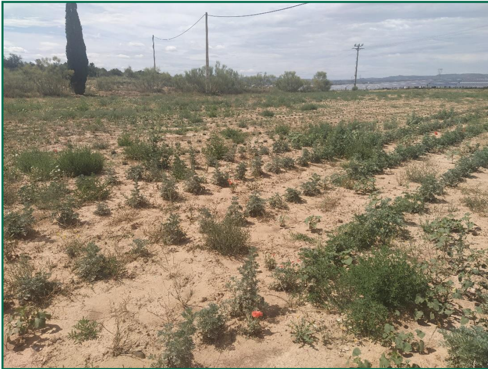
Fotografía 4. Detalle de las plantas de artemisa en la actualidad en zona sin placas.