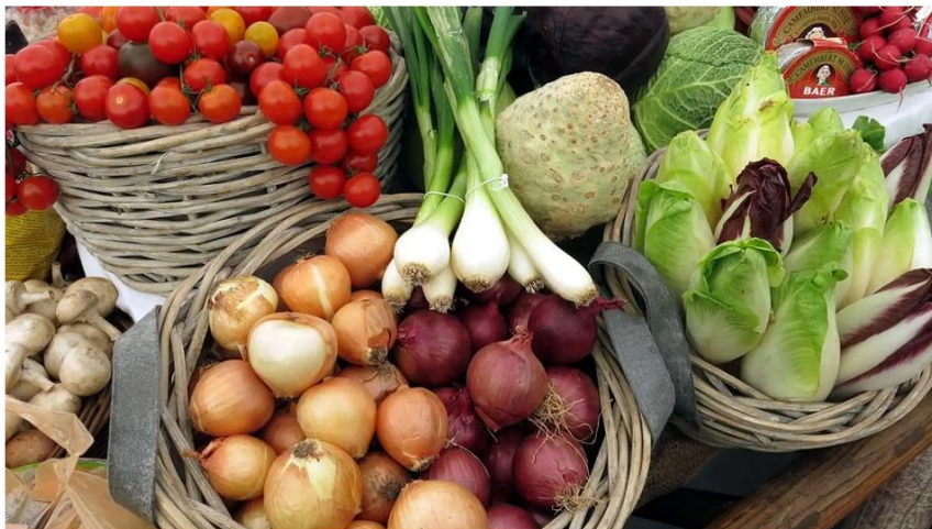
Cesta de la compra

Los precios han moderado su crecimiento en agosto en Aragón. La inflación interanual se sitúa en un 11,1%, seis décimas por encima de la media nacional. Por provincias, el IPC es del 11,7% en Huesca, 11,5% en Teruel y 10,9% en Zaragoza . La electricidad es el grupo que más tira de los precios con un aumento del 27% en los últimos doce meses . En segunda posición, se situó en agosto Alimentos y bebidas no alcohólicas, con un ascenso del 13,9%.