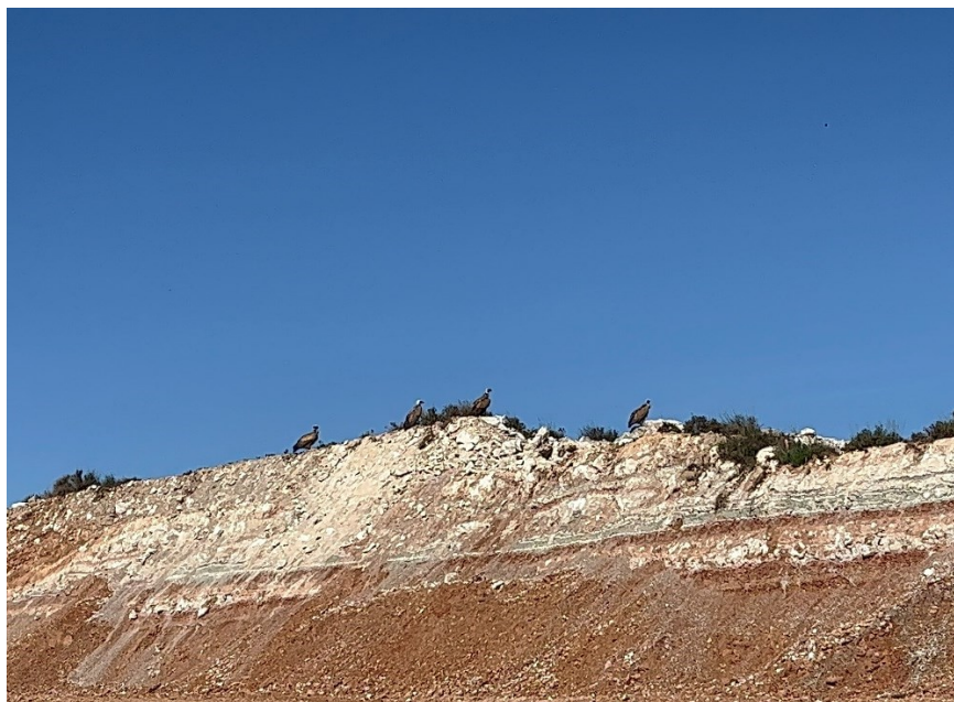
Figura 2 Buitre leonado (Gyps fulvus)

El presente anexo se compone de un número representativo de fotografías del total realizado durante el periodo evaluado, escogidas por su relevancia y/o carácter explicativo para la correcta comprensión del presente informe.