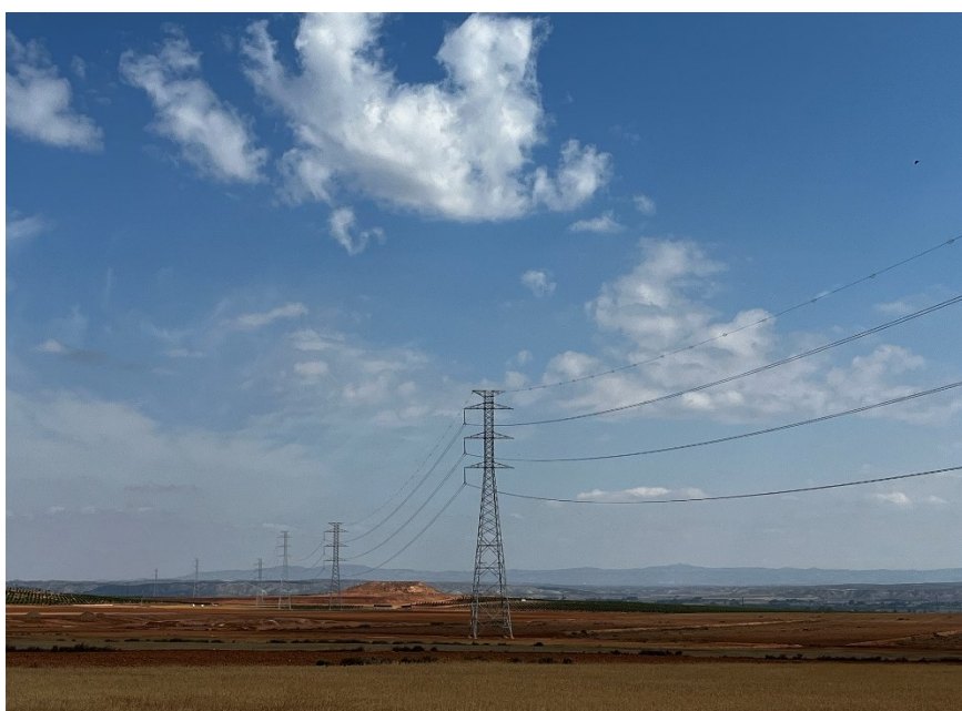
Figura 3 LAAT SET Valdompere-SET Fuentes