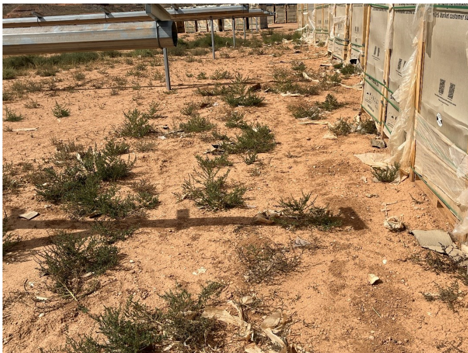
Figura 8 Restos de plásticos