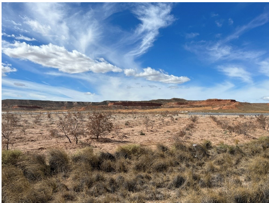
Figura 5 Masa de pinar trasplantada

El presente anexo se compone de un número representativo de fotografías del total realizado durante el periodo evaluado, escogidas por su relevancia y/o carácter explicativo para la correcta comprensión del presente informe.