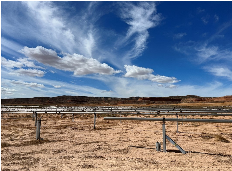
Figura 7 Montaje de los trackers