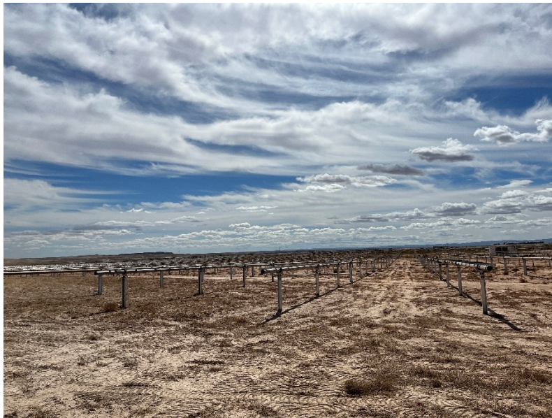
Figura 2 Montaje de los trackers

Durante este mes, se ha continuado con el montaje de los trackers (Figura 2).