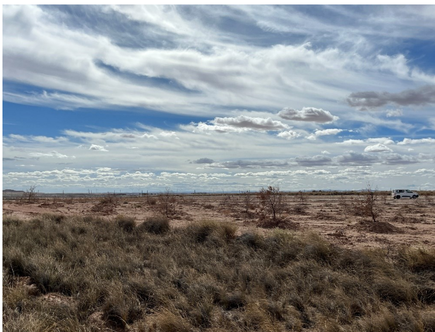
Figura 6 Masa de pinar trasplantada