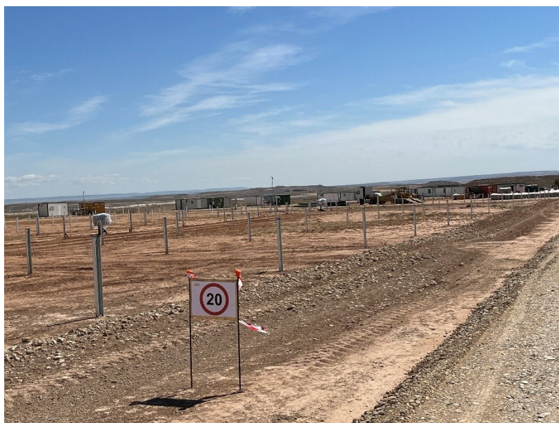
Figura 4 Señalización en obra

La obra dispone de cuba de agua y se realizan riegos con regularidad. Además, la obra cuenta con un límite de velocidad establecido de 20km/h para reducir de esta forma las emisiones de polvo.