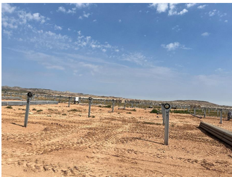
Figura 2 Hincado

Durante este mes, se ha comenzado con el montaje de los trackers (Figura 2).