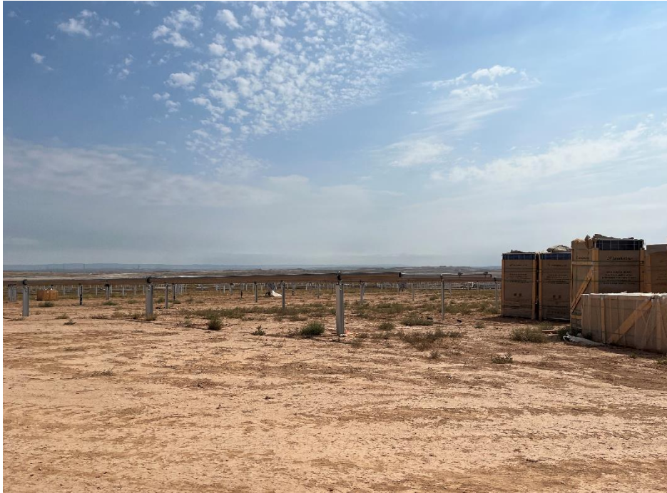
Figura 8 Montaje de los trackers