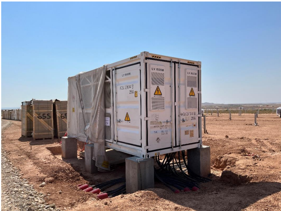
Figura 9 Conexión de CT