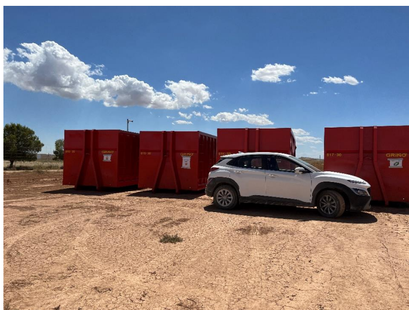
Figura 3 Punto limpio RNP dispuesto dentro de la planta

El punto limpio de residuos no peligrosos de la zona de acopio logístico y el dispuesto dentro de la planta consta de cinco contenedores, uno para restos plásticos (bolsa de basura, botellas, tubos corrugados...), cartón, flejes, madera y plástico blando. También hay una zona para los restos de ferralla.