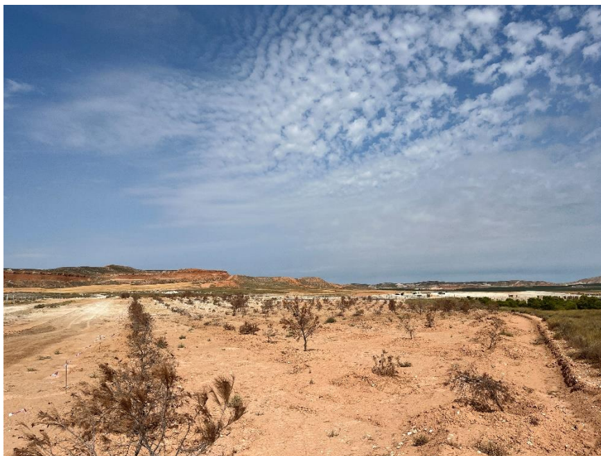
Figura 6 Masa de pinar trasplantada

El presente anexo se compone de un número representativo de fotografías del total realizado durante el periodo evaluado, escogidas por su relevancia y/o carácter explicativo para la correcta comprensión del presente informe.