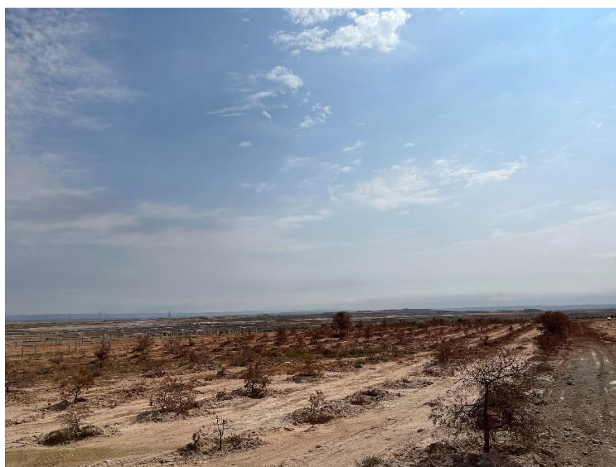
Figura 7 Masa de pinar trasplantada