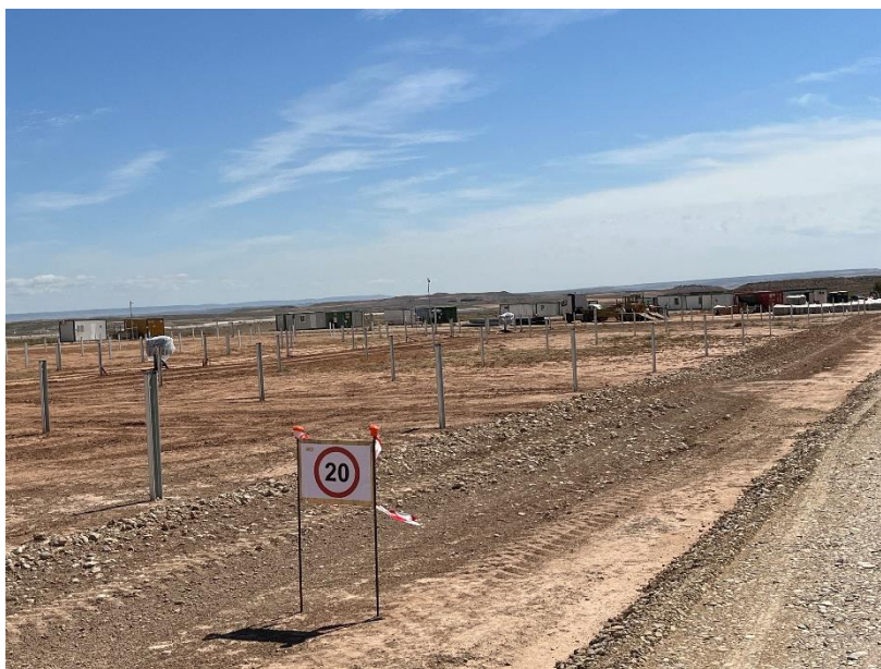
Figura 5 Señalización en obra

La obra dispone de cuba de agua y se realizan riesgos con regularidad. Además, la obra cuenta con un límite de velocidad establecido de 20km/h para reducir de esta forma las emisiones de polvo.