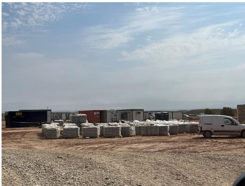
Figura 4 Zona de acopio

En la planta se mantiene un nivel de orden y limpieza óptimo. El acopio logístico de materiales para la fase de construcción se ha realizado de manera correcta en las zonas destinadas para esta labor.