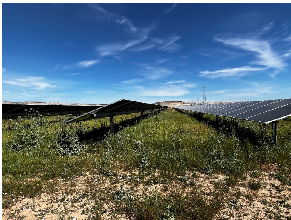
Figura 6 Crecimiento de la vegetación