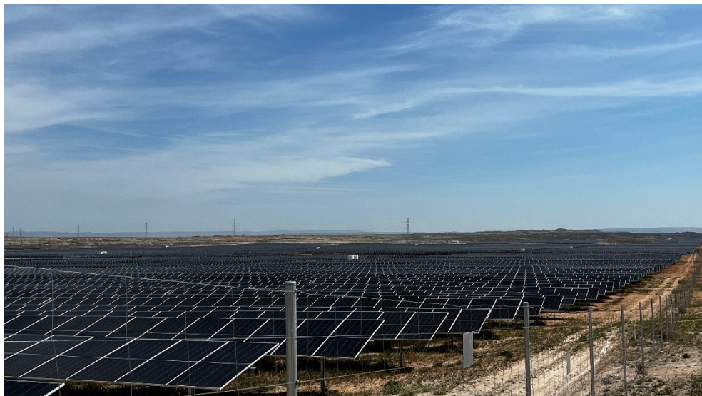
Figura 5 Valdompere 3