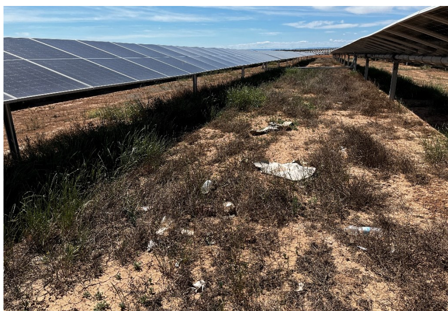
Figura 4 Restos de plásticos