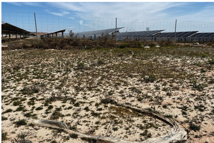
Figura 3 Restos de plásticos

El presente anexo se compone de un número representativo de fotografías del total realizado durante el periodo evaluado, escogidas por su relevancia y/o carácter explicativo para la correcta comprensión del presente informe.