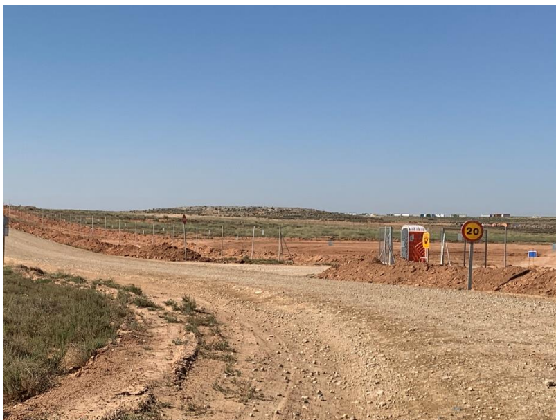
Figura 4 Señalización en obra

La obra dispone de cuba de agua y se realizan riegos con regularidad. Además, la obra cuenta con un límite de velocidad establecido de 20km/h para reducir de esta forma las emisiones de polvo.