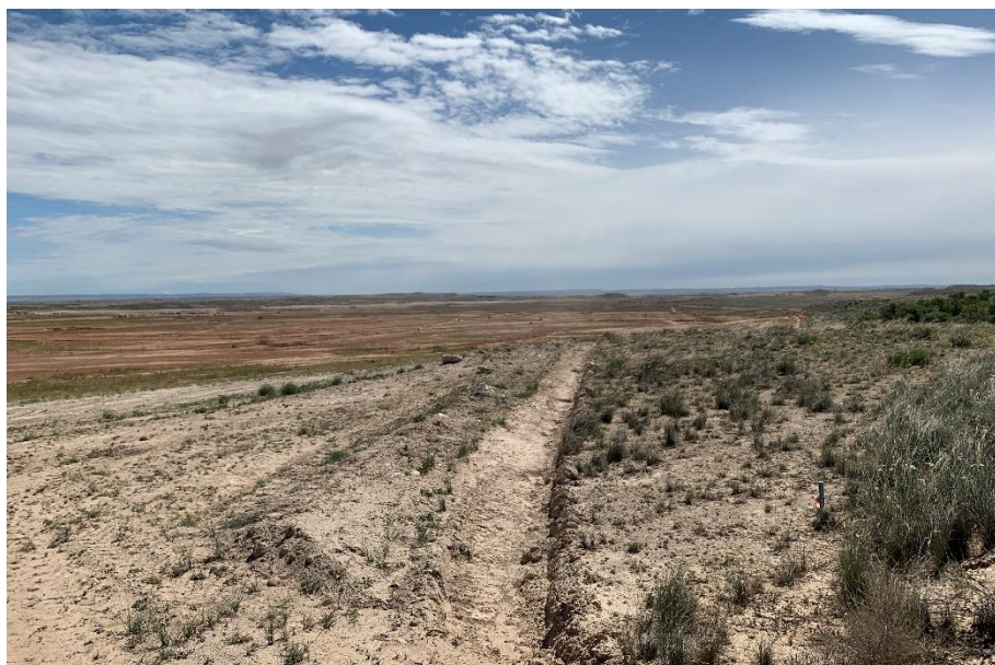
Figura 5 Zona de vegetación natural sin balizar

El presente anexo se compone de un número representativo de fotografías del total realizado durante el periodo evaluado, escogidas por su relevancia y/o carácter explicativo para la correcta comprensión del presente informe.