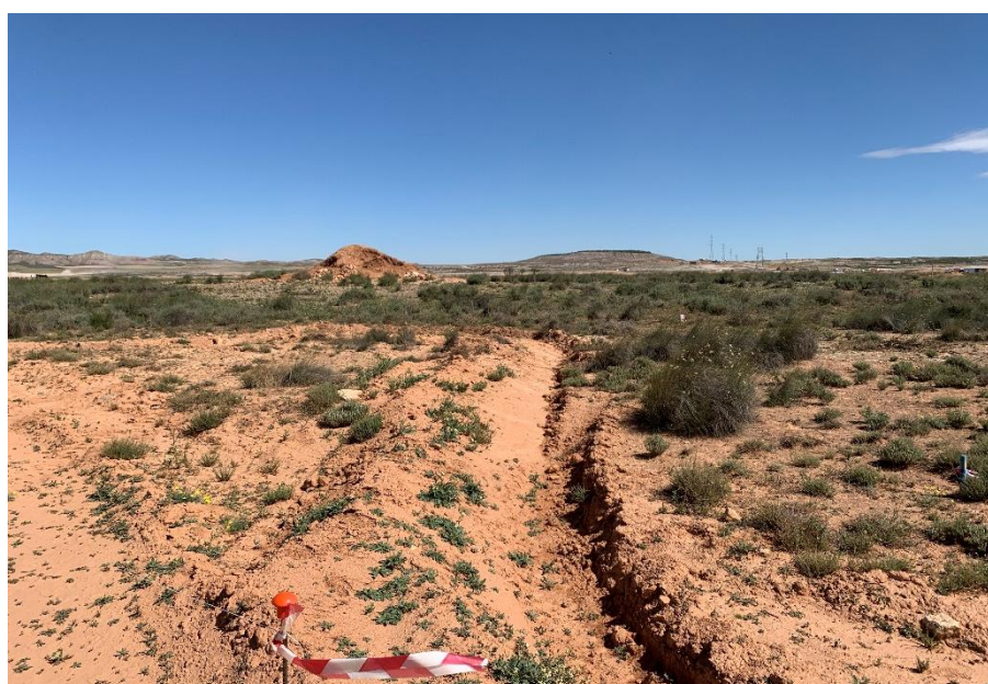
Figura 6 Balizado de la vegetación natural