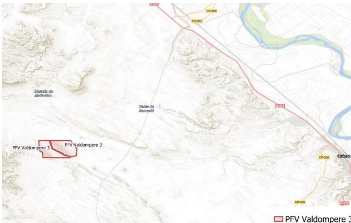
Figura 1 Localización del proyecto