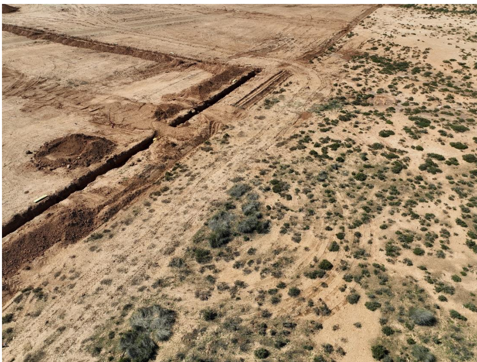
Figura 8 Afeción a zona de vegetación natural