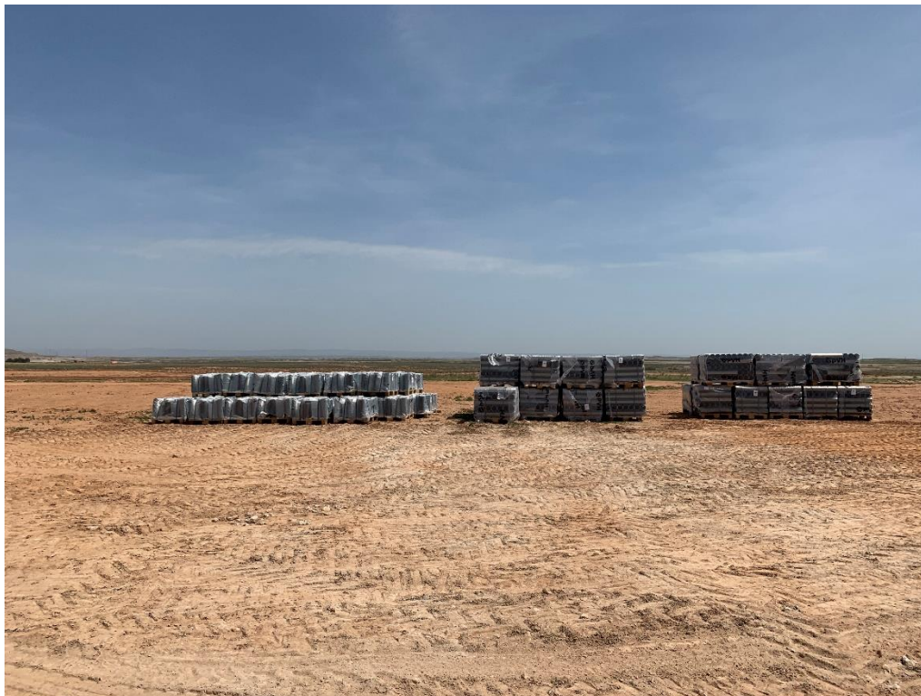
Figura 9 Zona de acopio