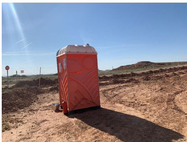
Figura 3 Baño químico

La ejecución de los trabajos no afecta a cauces ni cursos de agua, tanto temporales como permanentes y la gestión de aguas residuales (baños químicos) se realiza correctamente.