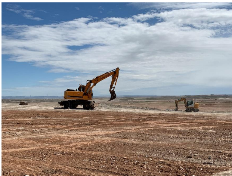
Figura 2 Movimientos de tierra

Durante este mes se ha continuado con las labores de movimientos de tierras, apertura de zanjas de la red de media y baja tensión, apertura de viales y de las cimentación de los CT's.