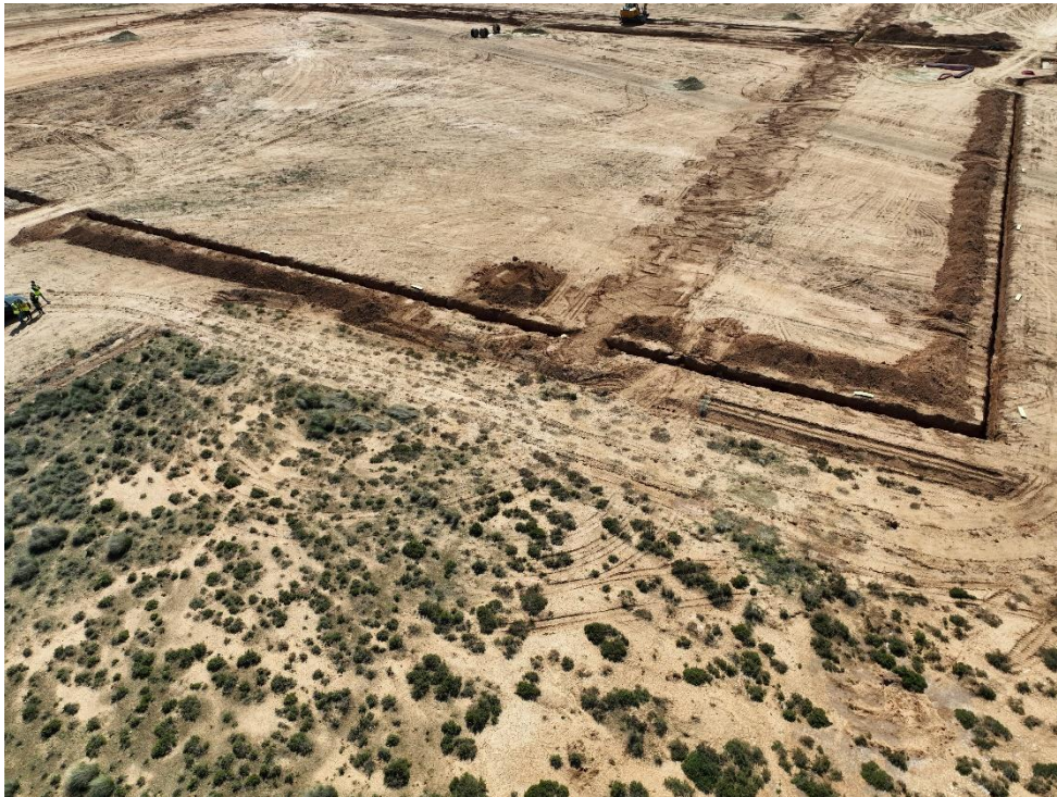
Figura 7 Afeción a zona de vegetación natural