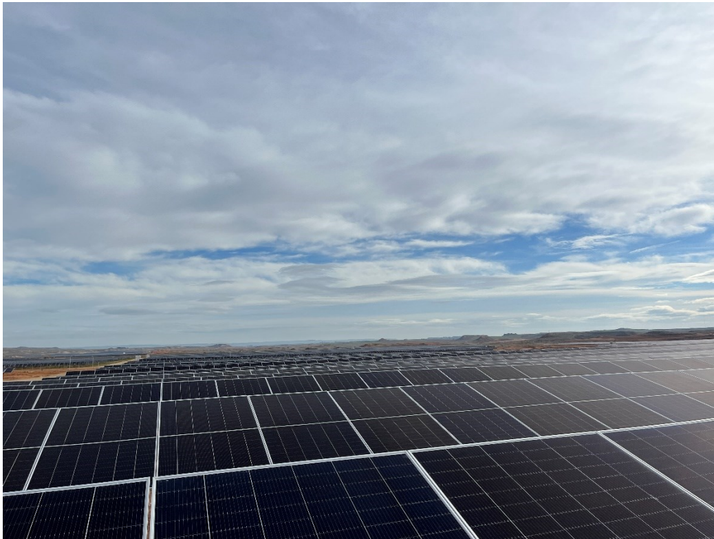
Figura 9 Montaje de los módulos