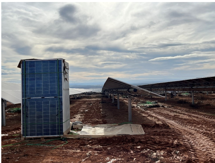
Figura 3 Montaje de los módulos fotovoltaicos

Se ha continuado con el montaje de los módulos fotovoltaicos.