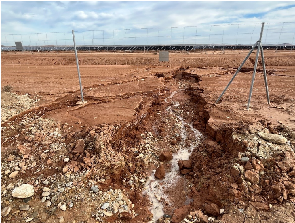
Figura 10 Efectos erosivos