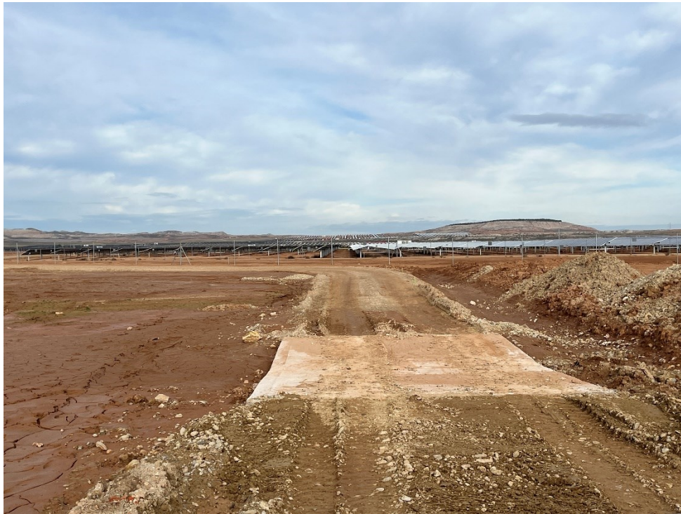
Figura 7 Cimentación del vial interno