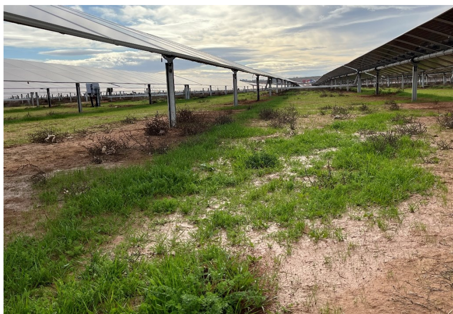
Figura 6 Crecimiento de la vegetación bajo los módulos