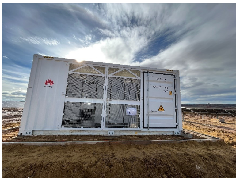
Figura 2 Encofrado de la base de los CT

Se han cimentado diferentes puntos del vial interno con mayor probabilidad erosiva y se ha preparado para cimentar la base de los CT.