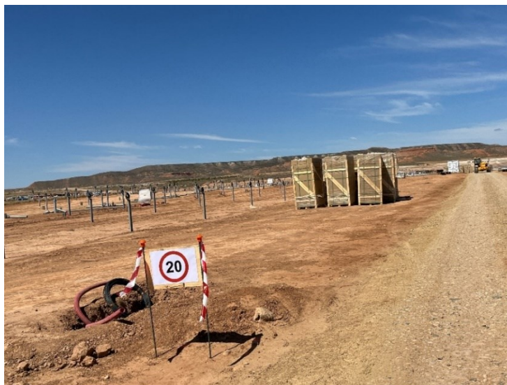
Figura 4 Señalización en obra

La obra dispone de cuba de agua y se realizan riegos con regularidad. Además, la obra cuenta con un límite de velocidad establecido de 20km/h para reducir de esta forma las emisiones de polvo.