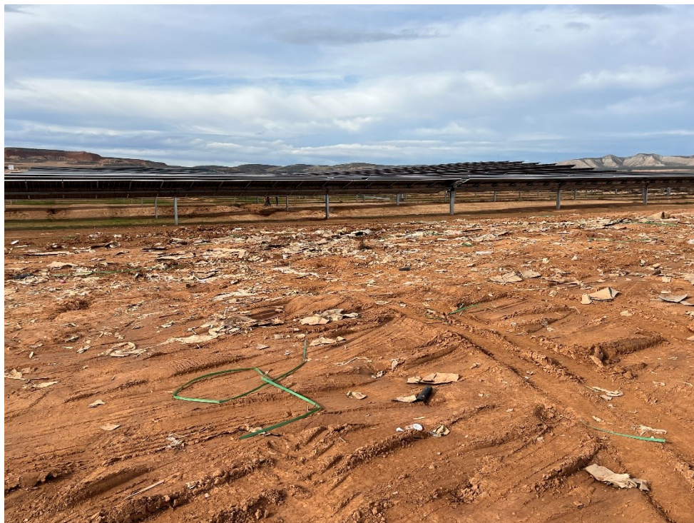
Figura 8 Restos de plásticos