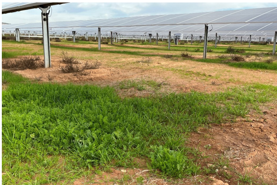
Figura 5 Crecimiento de la vegetación bajo los módulos

El presente anexo se compone de un número representativo de fotografías del total realizado durante el periodo evaluado, escogidas por su relevancia y/o carácter explicativo para la correcta comprensión del presente informe.