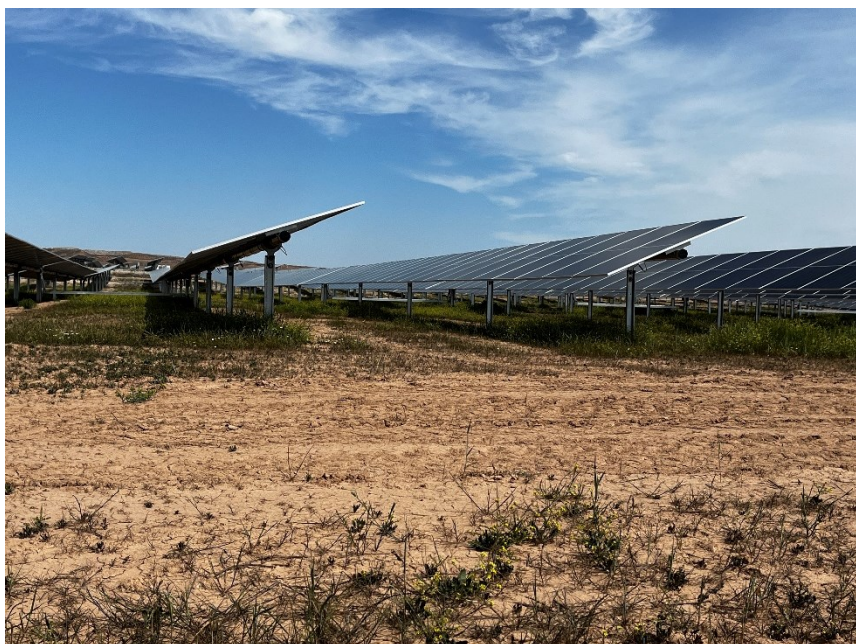
Figura 3 Crecimiento de la vegetación bajo los módulos

El presente anexo se compone de un número representativo de fotografías del total realizado durante el periodo evaluado, escogidas por su relevancia y/o carácter explicativo para la correcta comprensión del presente informe.