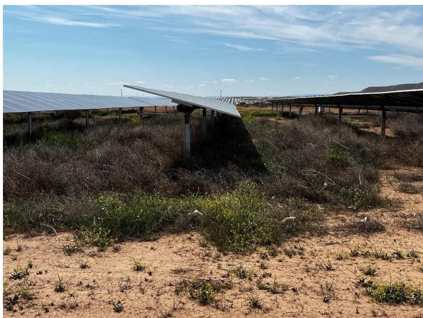
Figura 4 Restos de plásticos