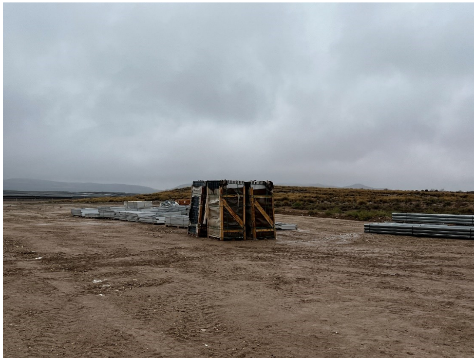
Figura 7 Acopio del material de construcción