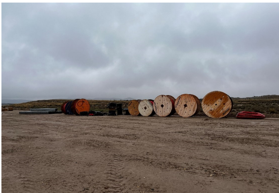
Figura 6 Acopio del material de construcción