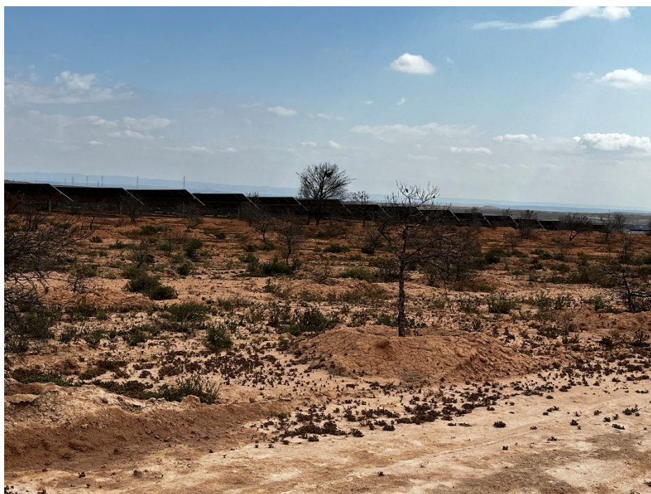
Figura 2 Masa de pinar trasplantada

Se ha continuado con el seguimiento de la evolución de la masa de pinar trasplantada durante los meses de Marzo y Abril, siendo esta muy negativa, con un índice de supervivencia del 0%.