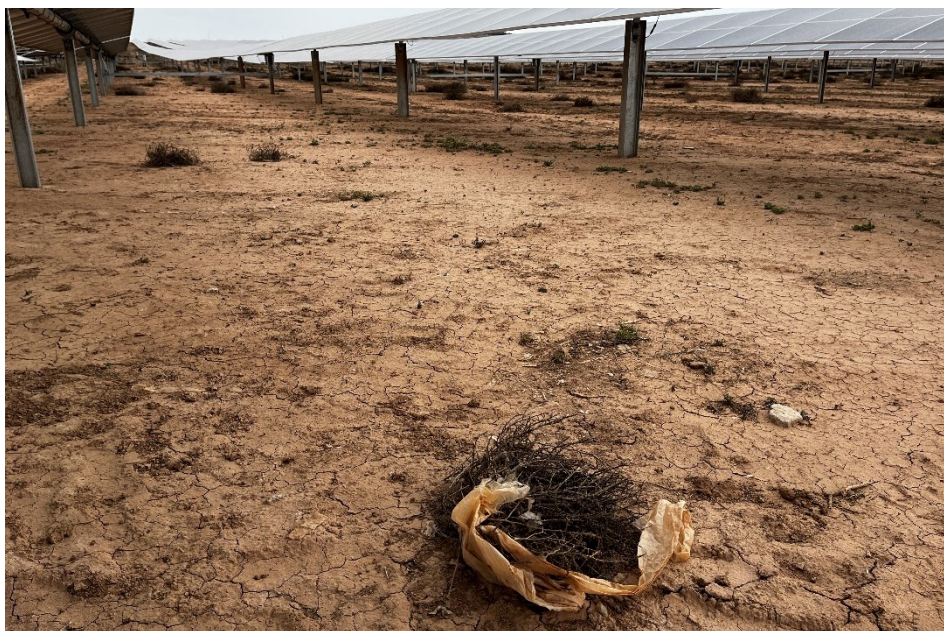
Figura 5 Restos de plásticos

El presente anexo se compone de un número representativo de fotografías del total realizado durante el periodo evaluado, escogidas por su relevancia y/o carácter explicativo para la correcta comprensión del presente informe.