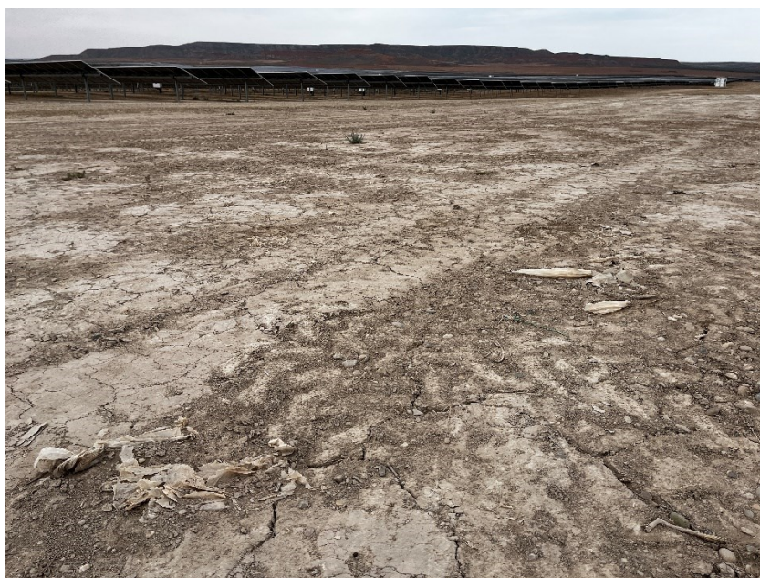
Figura 3 Restos de plásticos

Durante las últimas visitas se han observado abundantes trozos de plástico procedentes de el embalaje de las cajas de los módulos fotovoltaicos.