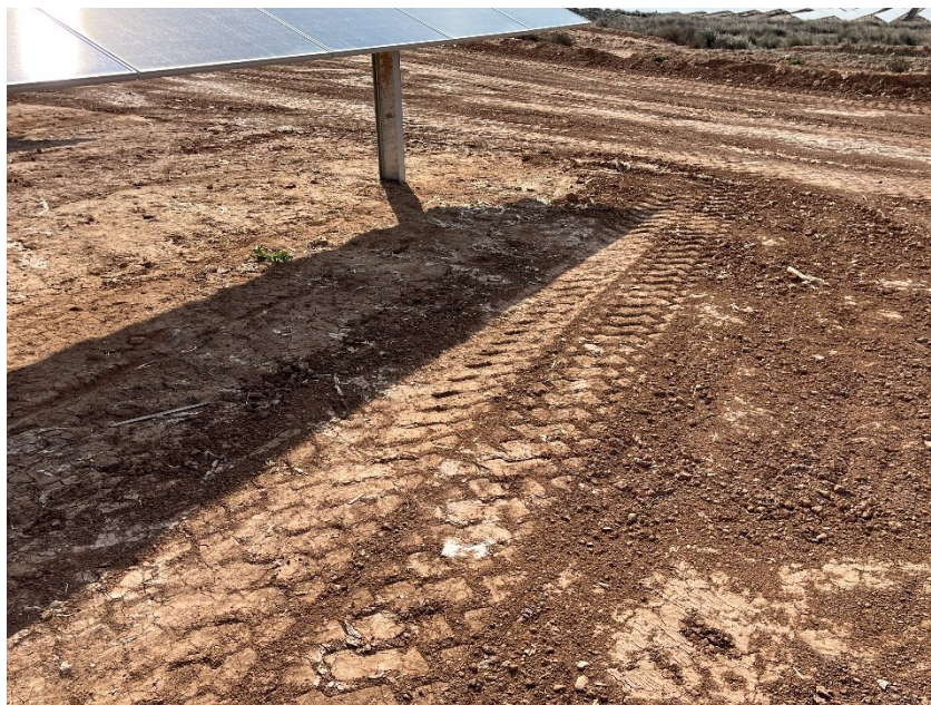
Figura 3 Restos de plásticos

Durante las últimas visitas se han observado abundantes trozos de plástico procedentes de el embalaje de las cajas de los módulos fotovoltaicos.