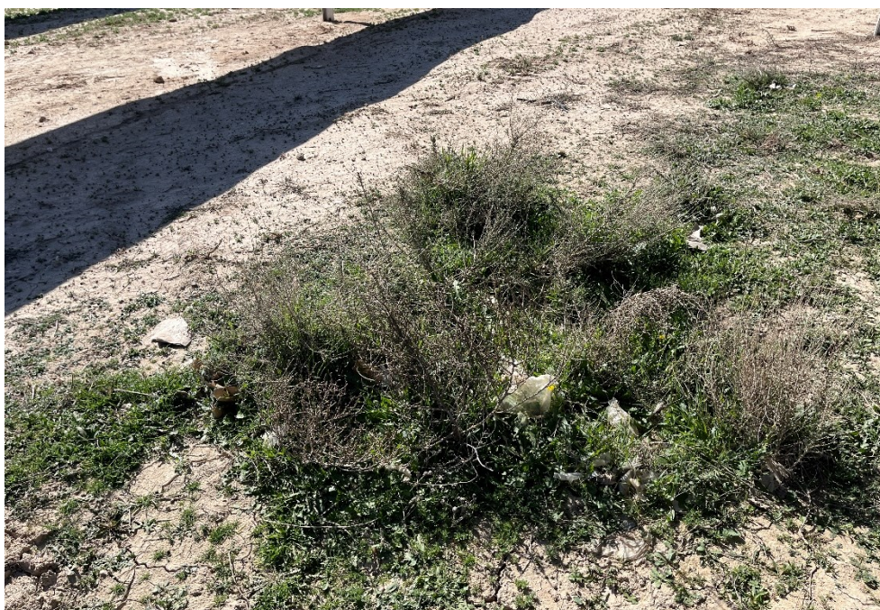
Figura 6 Restos de plásticos