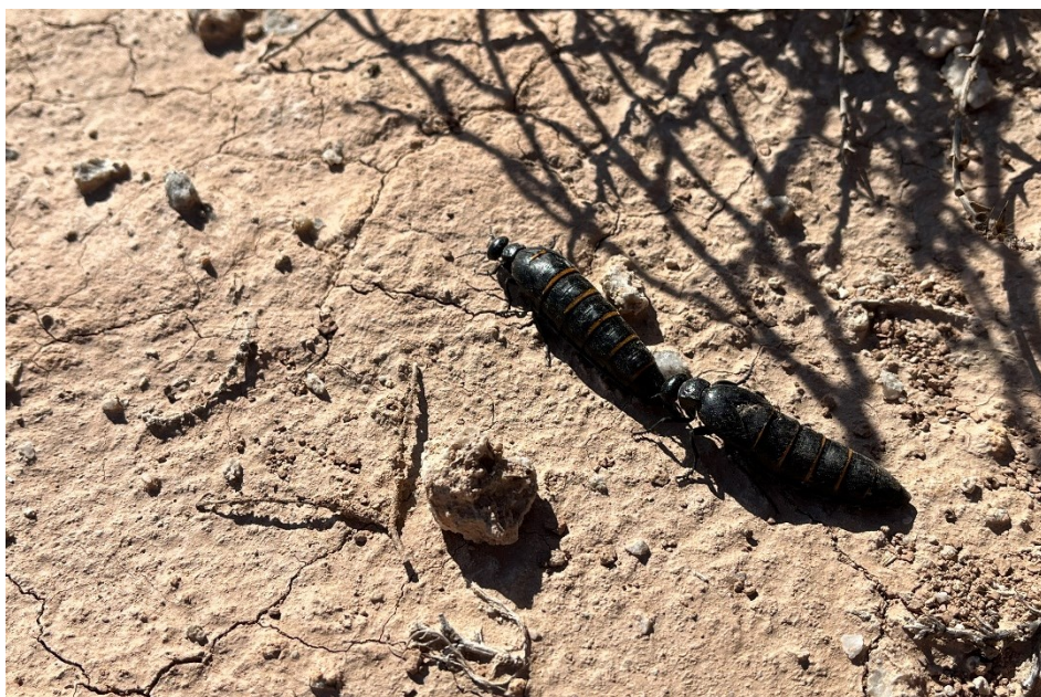
Figura 5 Aceitera común (Berberomeloe majalis)

El presente anexo se compone de un número representativo de fotografías del total realizado durante el periodo evaluado, escogidas por su relevancia y/o carácter explicativo para la correcta comprensión del presente informe.