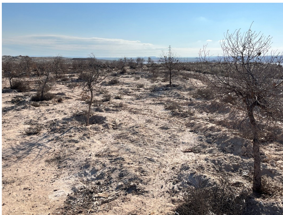
Figura 2 Masa de pinar trasplantada

Se ha continuado con el seguimiento de la evolución de la masa de pinar trasplantada durante los meses de Marzo y Abril, siendo esta muy negativa, con un índice de supervivencia del 0%.