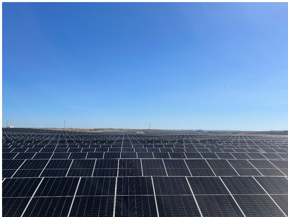
Figura 7 Valdompere 1