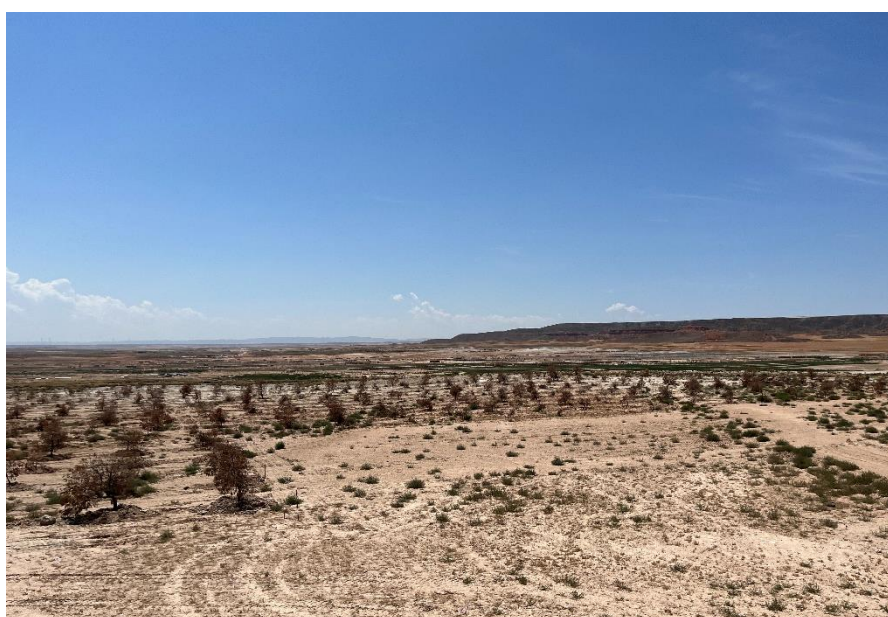
Figura 5 Masa de pinar trasplantada