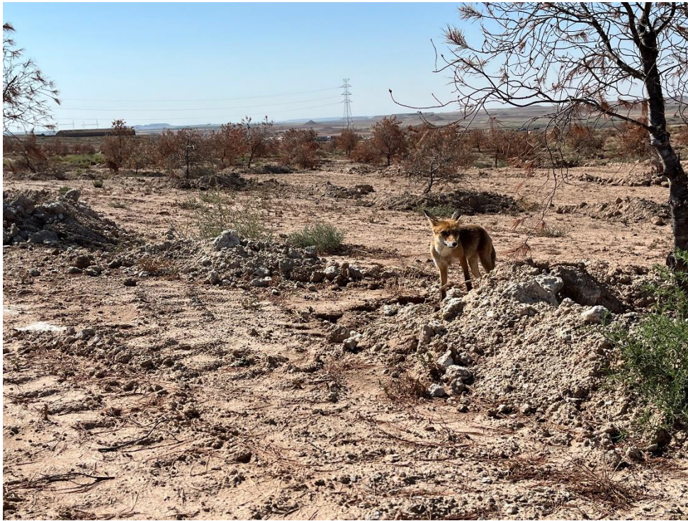
Figura 6 Ejemplar de zorro (Vulpes vulpes)