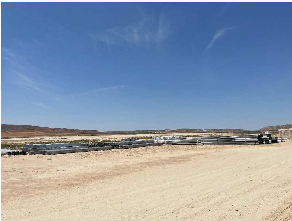
Figura 7 Zona de acopio de material de construcción