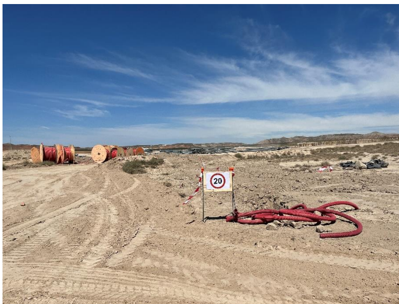
Figura 3 Señalización en obra

La obra dispone de cuba de agua y se realizan riesgos con regularidad. Además, la obra cuenta con un límite de velocidad establecido de 20km/h para reducir de esta forma las emisiones de polvo.