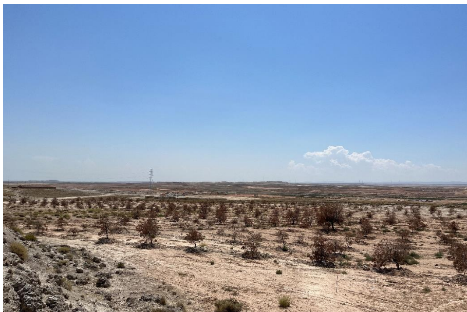
Figura 4 Masa de pinar trasplantada

El presente anexo se compone de un número representativo de fotografías del total realizado durante el periodo evaluado, escogidas por su relevancia y/o carácter explicativo para la correcta comprensión del presente informe.