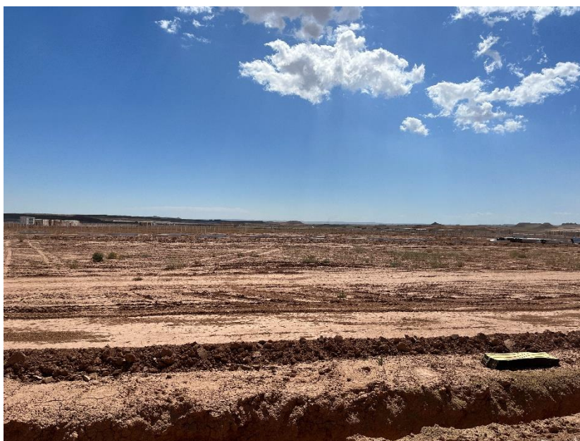
Figura 2 Apertura de zanjas para la RMT

Durante este mes se ha finalizado con las labores de movimientos de tierras, cimentaciones, apertura de zanjas de la red de media, y continúan la apertura de zanjas de la red de baja tensión (Figura 2).