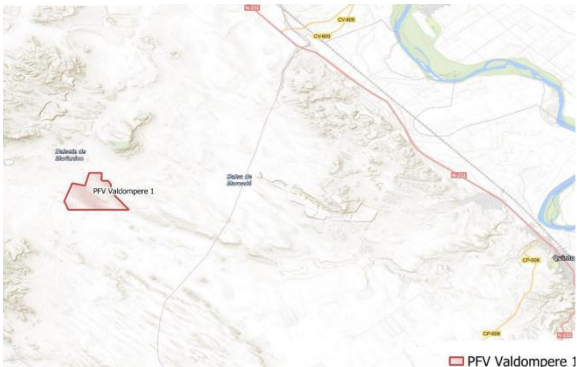
Figura 1 Localización del proyecto

Se localiza a 7 km al sureste de esta localidad sobre parcelas dedicadas al cultivo de cereal de secano en extensivo. El paraje donde se ubica la planta (Figura 1) se denomina "Valdecara" y se encuentra a 350 msnm aproximadamente.