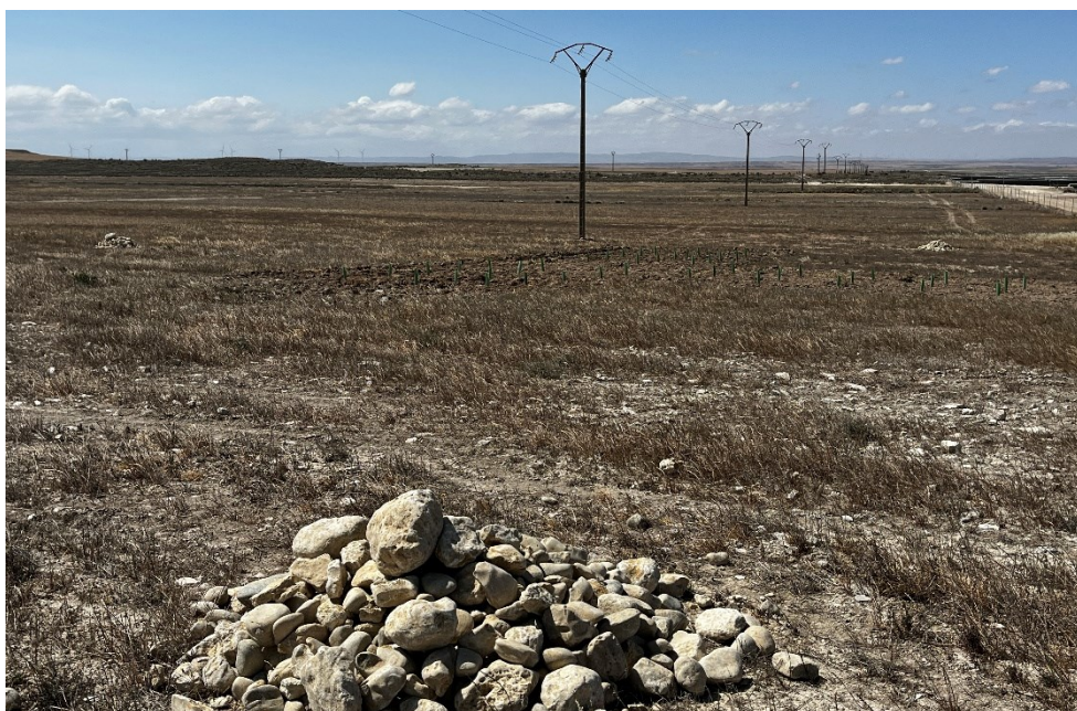
Figura 4 Majanos y bosquetes