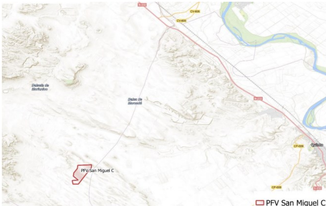
Figura 1 Localización de la PFV San Miguel C

En la siguiente imagen (Figura 1) se puede ver la localización del proyecto San Miguel C: