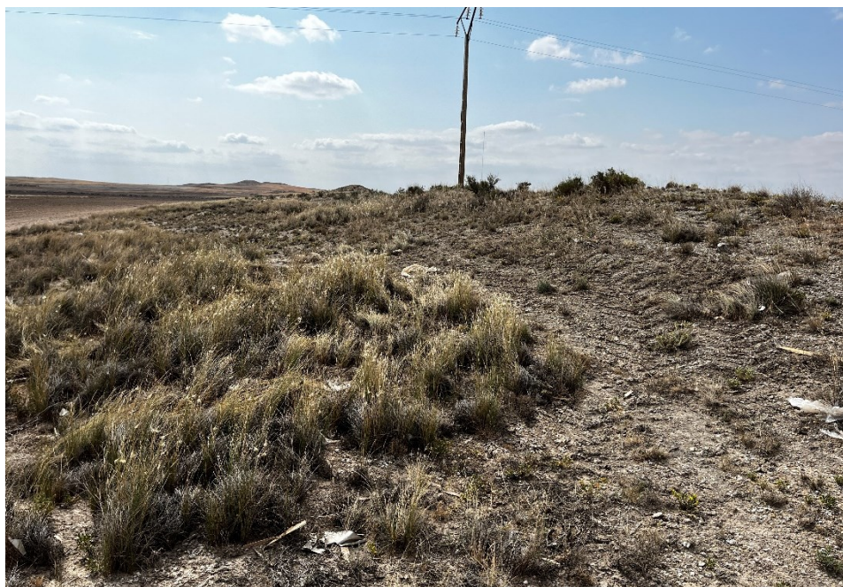
Figura 3 Restos de plásticos

El presente anexo se compone de un número representativo de fotografías del total realizado durante el periodo evaluado, escogidas por su relevancia y/o carácter explicativo para la correcta comprensión del presente informe.