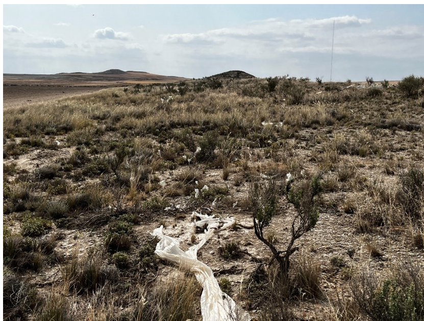
Figura 2 Restos de plásticos

Durante las últimas visitas se observaron abundantes trozos de plástico procedentes del embalaje de los módulos fotovoltaicos.