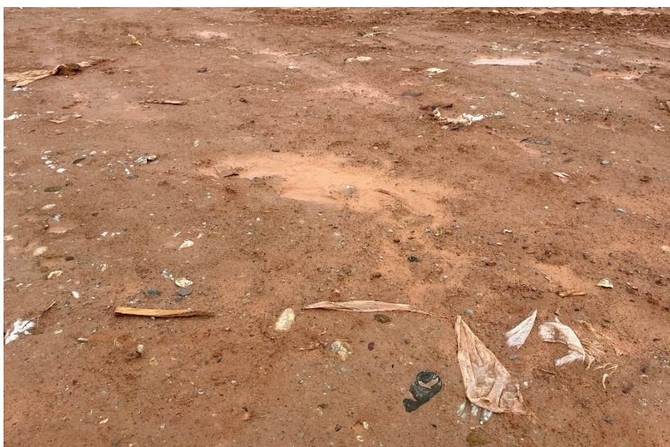
Figura 5 Restos de plásticos en el interior de la planta