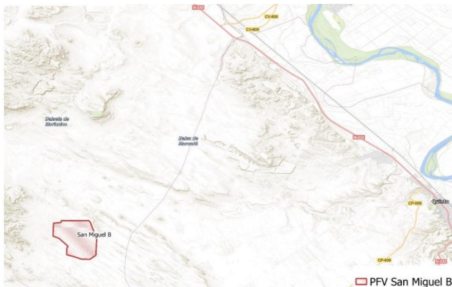
Figura 1 Localización del proyecto

El parque fotovoltaico se encuentra en las cercanías de la N-232, junto a la delimitación del término municipal de Quinto, el cual se encuentra a 8,77 km al Este del emplazamiento del proyecto. La distancia entre el parque fotovoltaico y el propio municipio de Fuentes de Ebro es de aproximadamente 9 km y está ubicado al Norte del vallado perimetral del parque. En la siguiente imagen (Figura 1) se puede ver la localización del parque fotovoltaico San Miguel B: