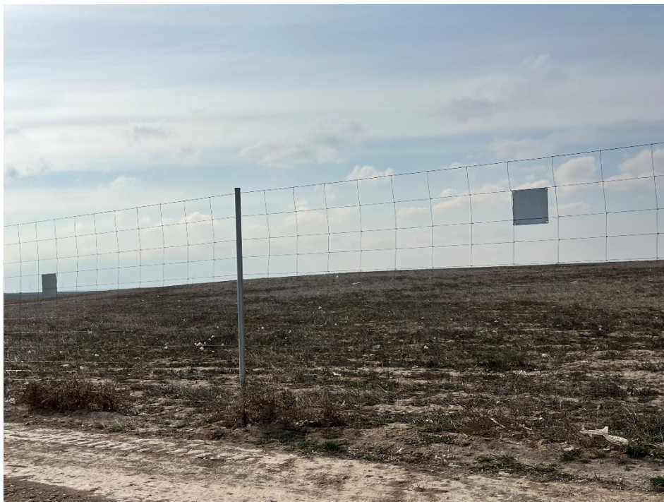
Figura 7 Restos de plásticos en el exterior de la planta