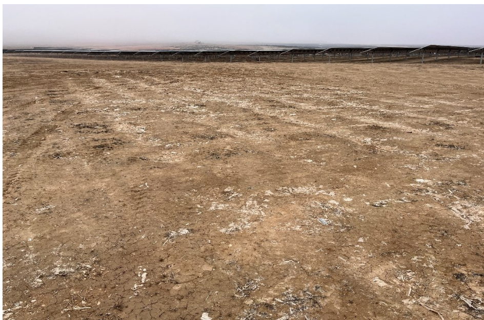
Figura 4 Restos de plásticos en el interior de la planta

El presente anexo se compone de un número representativo de fotografías del total realizado durante el periodo evaluado, escogidas por su relevancia y/o carácter explicativo para la correcta comprensión del presente informe.