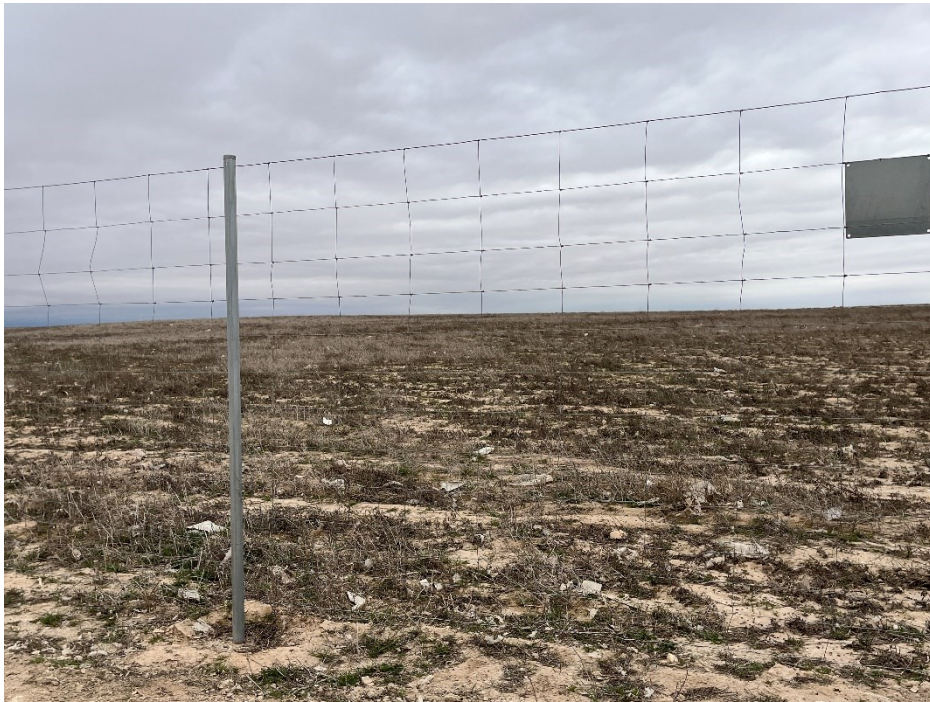
Figura 6 Restos de plásticos en el exterior de la planta