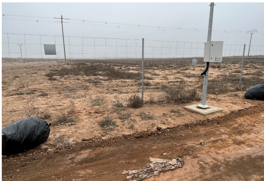
Figura 2 Restos de plásticos

El acopio logístico de materiales para la fase de construcción se ha realizado de manera correcta en las zonas destinadas para esta labor. También se ha dispuesto un punto limpio de RNP dentro de la planta.