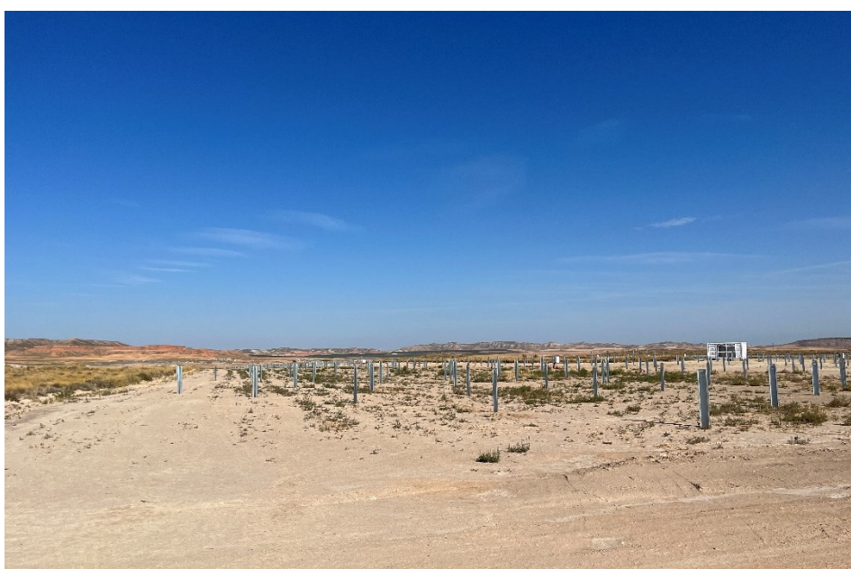
Figura 7 Hincado