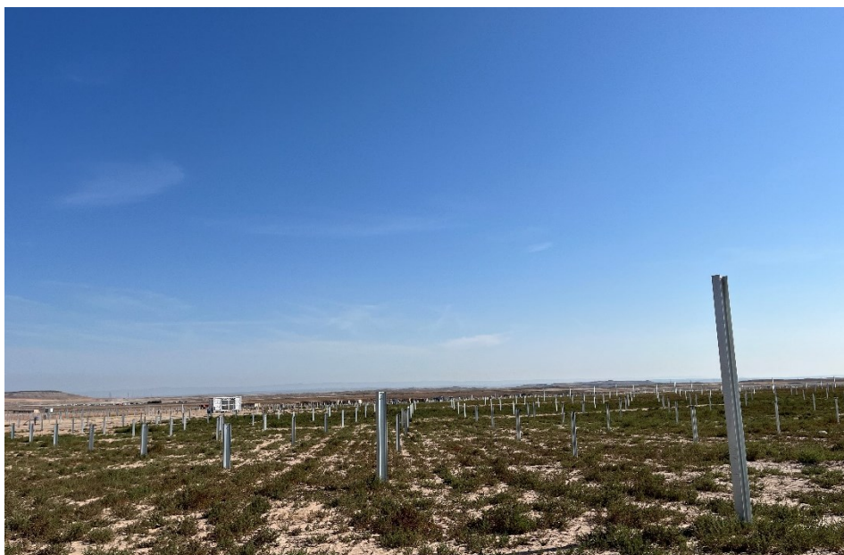
Figura 6 Hincado

El presente anexo se compone de un número representativo de fotografías del total realizado durante el periodo evaluado, escogidas por su relevancia y/o carácter explicativo para la correcta comprensión del presente informe.