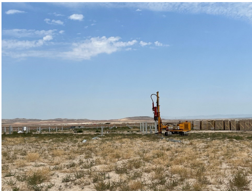
Figura 3 Labores de hincado