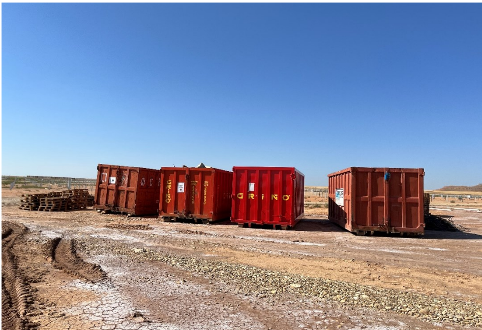
Figura 4 Punto limpio de RNP dispuesto dentro de la planta

En la planta se mantiene un nivel de orden y limpieza óptimo, aunque se han observado restos de plásticos procedentes de los embalajes de los módulos fotovoltaicos. El acopio logístico de materiales para la fase de construcción se ha realizado de manera correcta en las zonas destinadas para esta labor. También se ha dispuesto un punto limpio de RNP dentro de la planta (Figura 4).