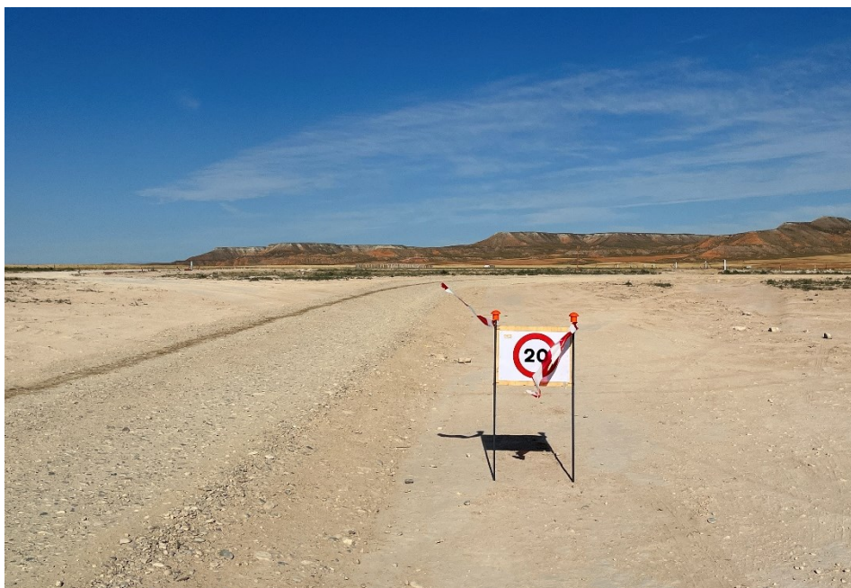
Figura 5 Señalización en obra

La obra dispone de cuba de agua y se realizan riesgos con regularidad. Además, la obra cuenta con un límite de velocidad establecido de 20km/h para reducir de esta forma las emisiones de polvo.