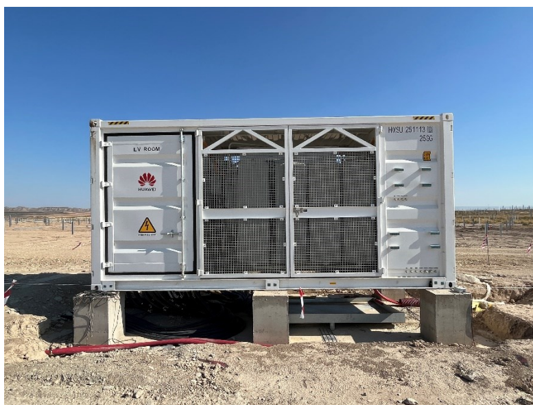
Figura 2 Conexión de los centros de transformación

Durante este mes, se ha continuado tendiendo el cable de media y baja tensión, y con la conexión de los centros de transformación y de los inversores.