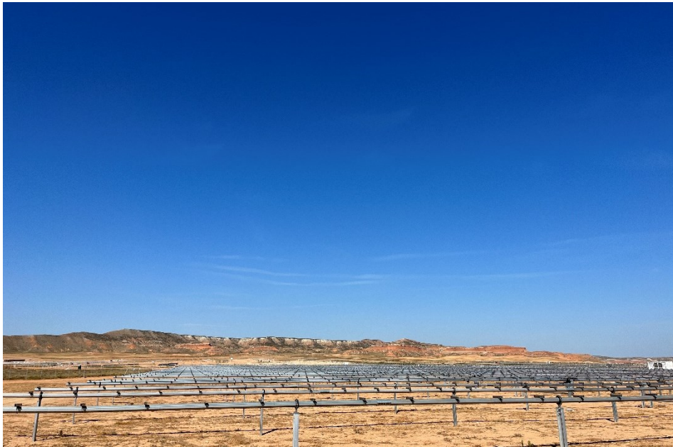
Figura 8 Montaje de los trackers