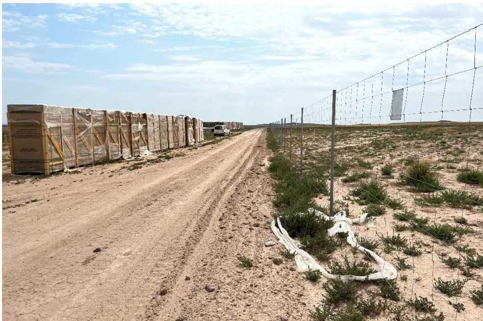
Figura 9 Restos de plásticos procedentes del embalaje de los módulos