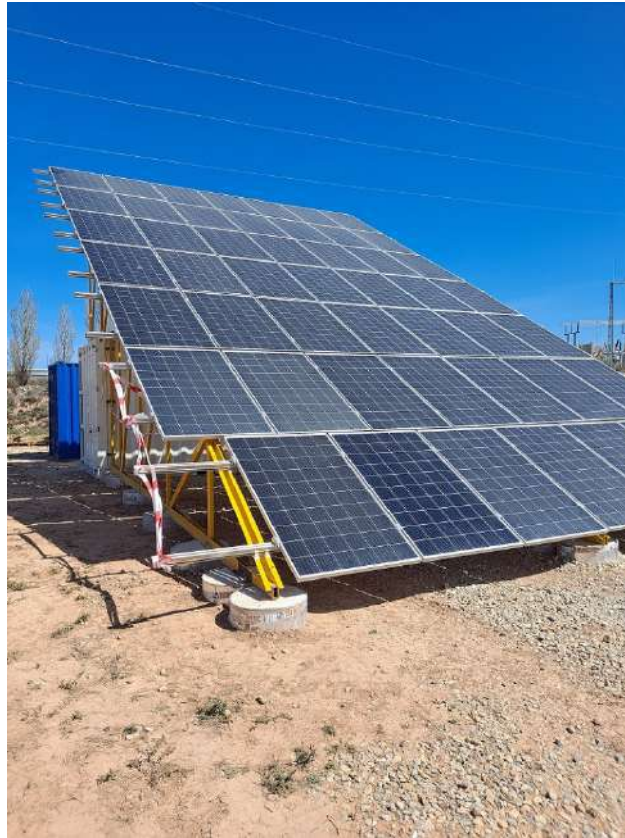
Isla solar autónoma instalada y en funcionamiento