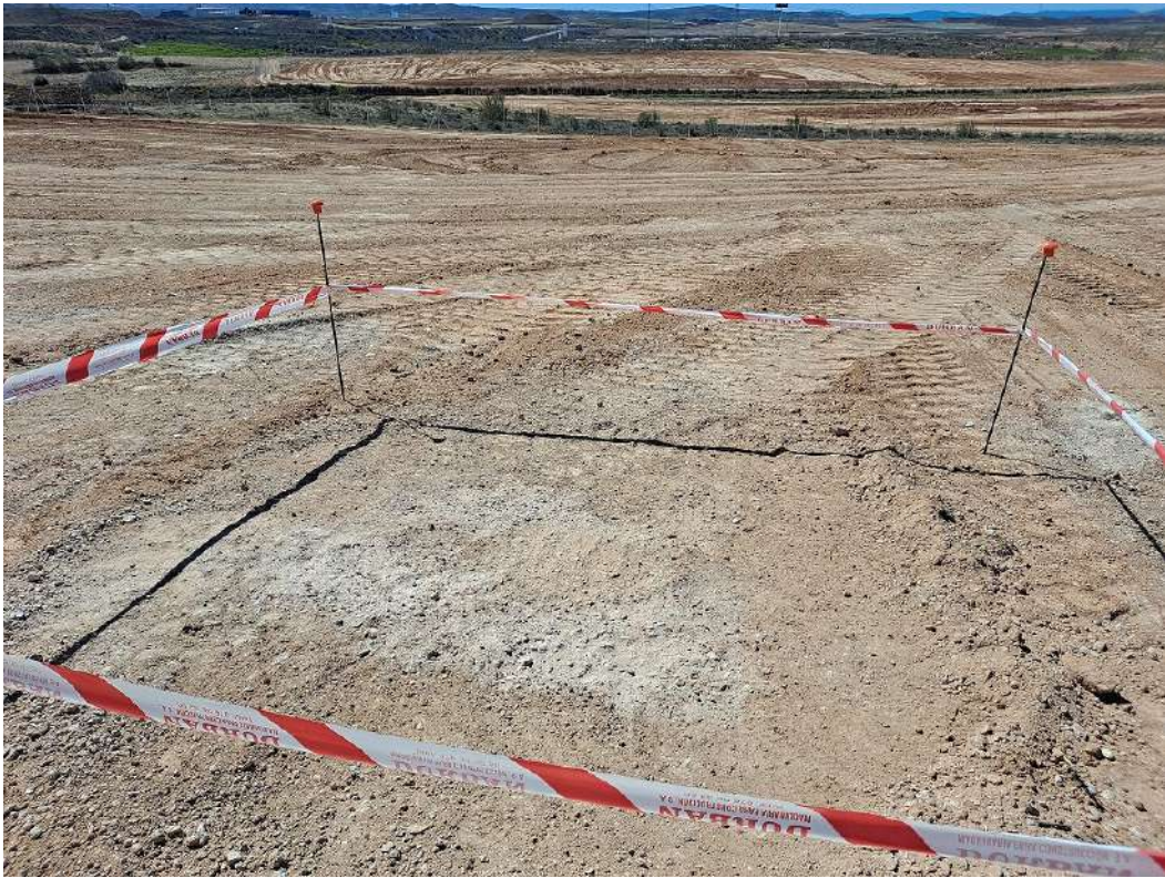
Restos de un pequeño vertido procedente de los baños químicos