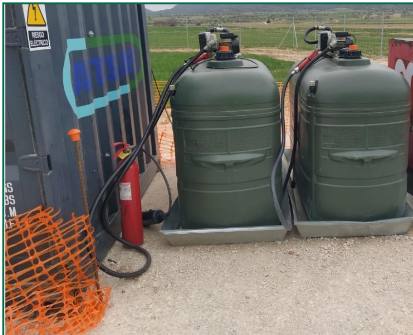
Fotografía 18. Extintor junto a contenedores de combustible.

Se dispone de extintores tanto en la zona de casetas como en la zona de obras.