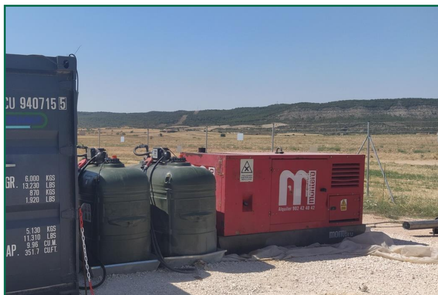
Fotografía 17. Bandejas para evitar derrames accidentales sobre el terreno.

En las visitas a obra realizadas se comprueba la utilización de bandejas de plástico debajo de los grupos electrógenos y envases de combustible para evitar derrames por pérdidas accidentales sobre el terreno.