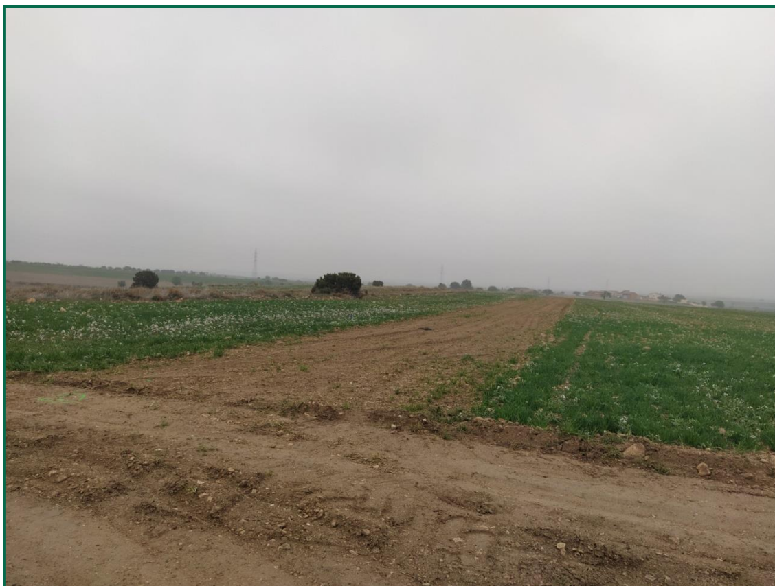
Fotografía 1. Jalonamiento previo.

No se realiza el balizamiento de todo el perímetro de la obra ya que se generaría una gran cantidad de residuos de malla de obra o cinta que tiende a romperse y dispersarse por toda la zona. Sí se realizó un jalonamiento del perímetro mediante banderines. La Dirección Ambiental realiza un control visual continuado para comprobar que no se sobrepasan los límites de la zona de ocupación. Actualmente se ha instalado el vallado perimetral.