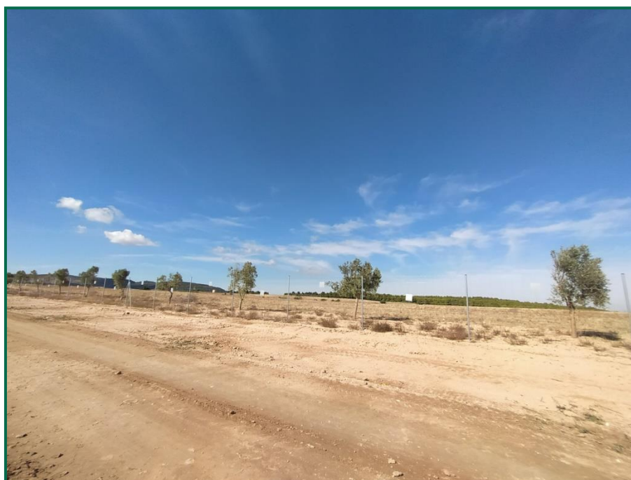
Fotografía 6. Olivos trasplantados.

Se reservaron más de 200 olivos de explotaciones interiores de la PFV para su trasplante a la pantalla vegetal perimetral, estos árboles fueron marcados y trasplantados durante el mes de abril. Se han seleccionado ejemplares ya maduros pero jóvenes, con un diámetro de tronco entre 10 y 25 cm aproximadamente, por considerarlos más aptos para el trasplante. Finalmente se han trasplantado 219 ejemplares repartidos por el vallado, con mayor concentración en la mitad norte de este y en la zona junto a la carretera, se han evitado zonas de vía pecuaria y aquellas zonas de menor cota propensas a inundaciones por ser menos aptas para este tipo de árbol.