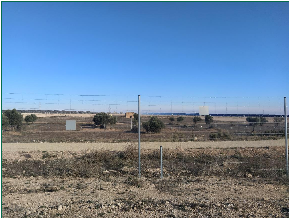
Fotografía 12. Vallado perimetral con paso de fauna.