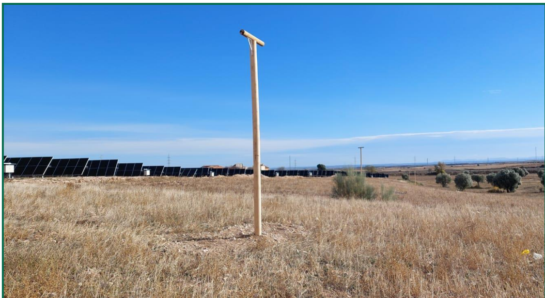
Fotografía 10. Posaderos.