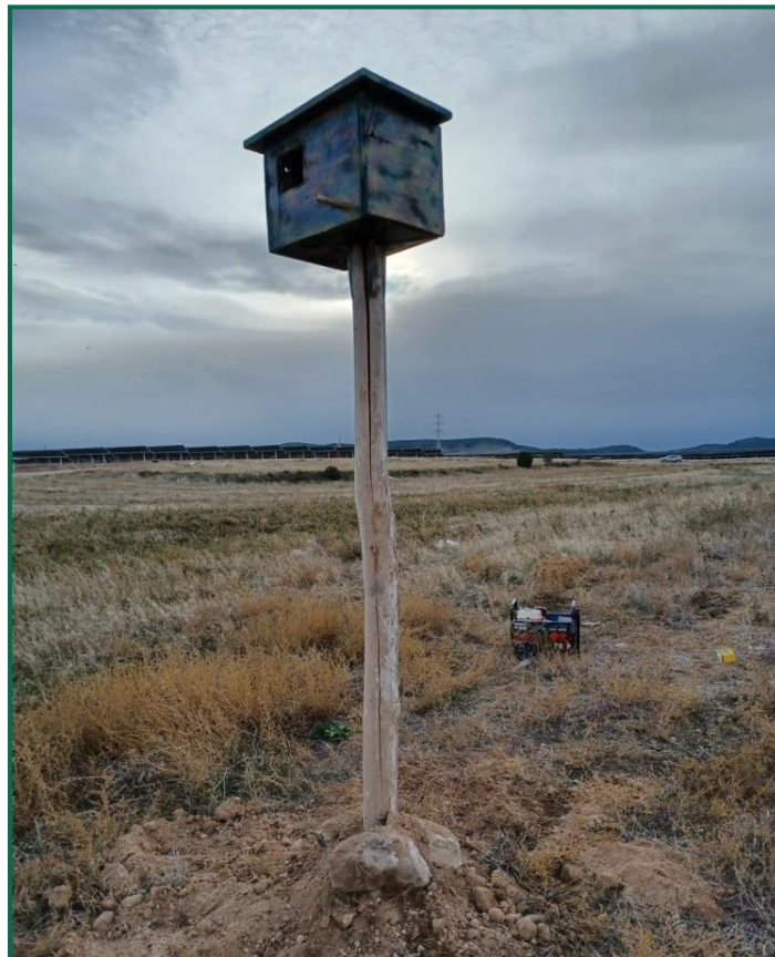
Fotografía 8. Nidal.