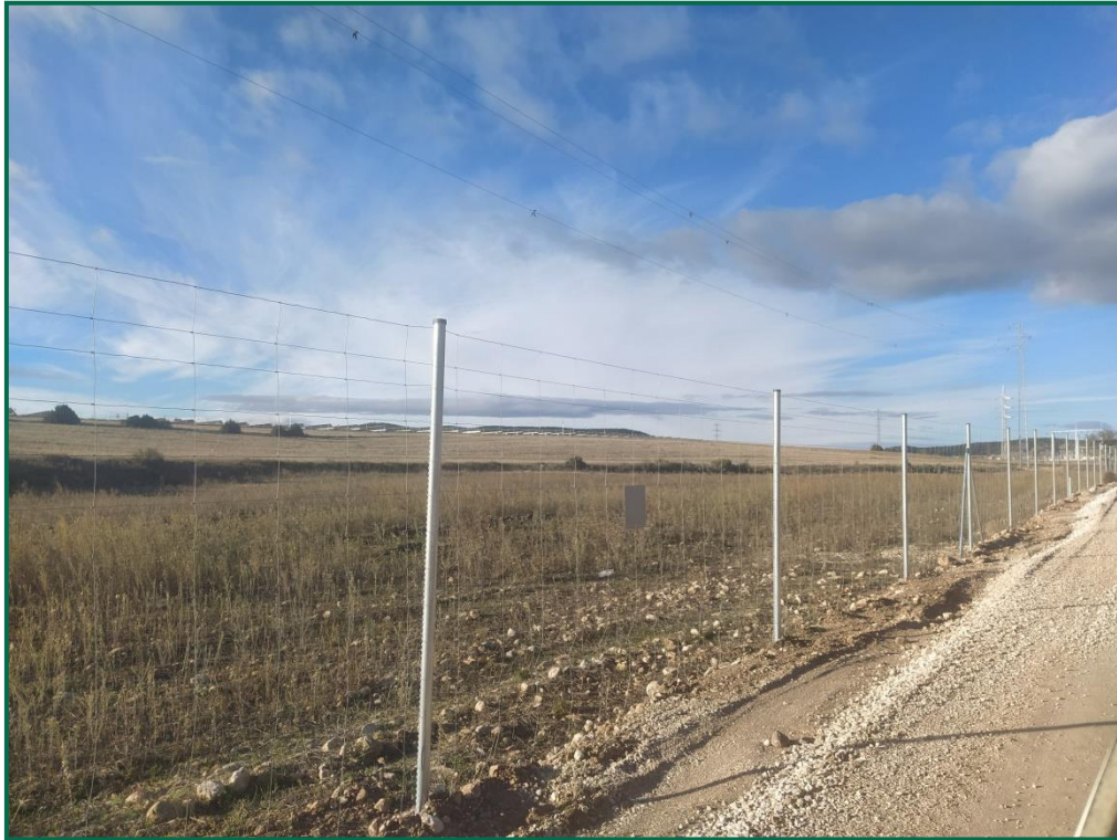
Fotografía 11. Vallado perimetral con placas anticolidión.