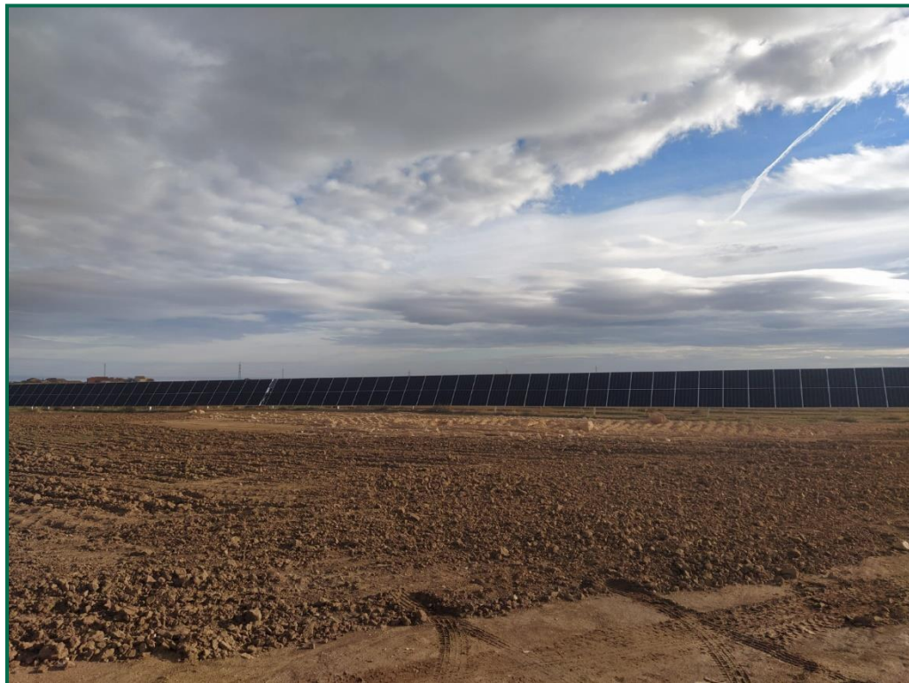
Fotografía 5. Zonas descompactadas.