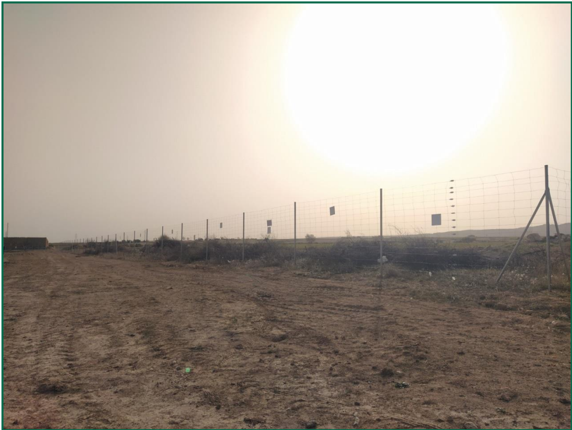
Fotografía 2. Vallado perimetral