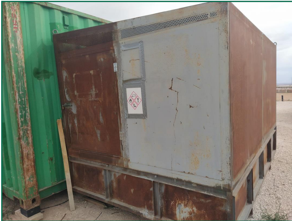
Fotografía 13. Contenedor residuos peligrosos.