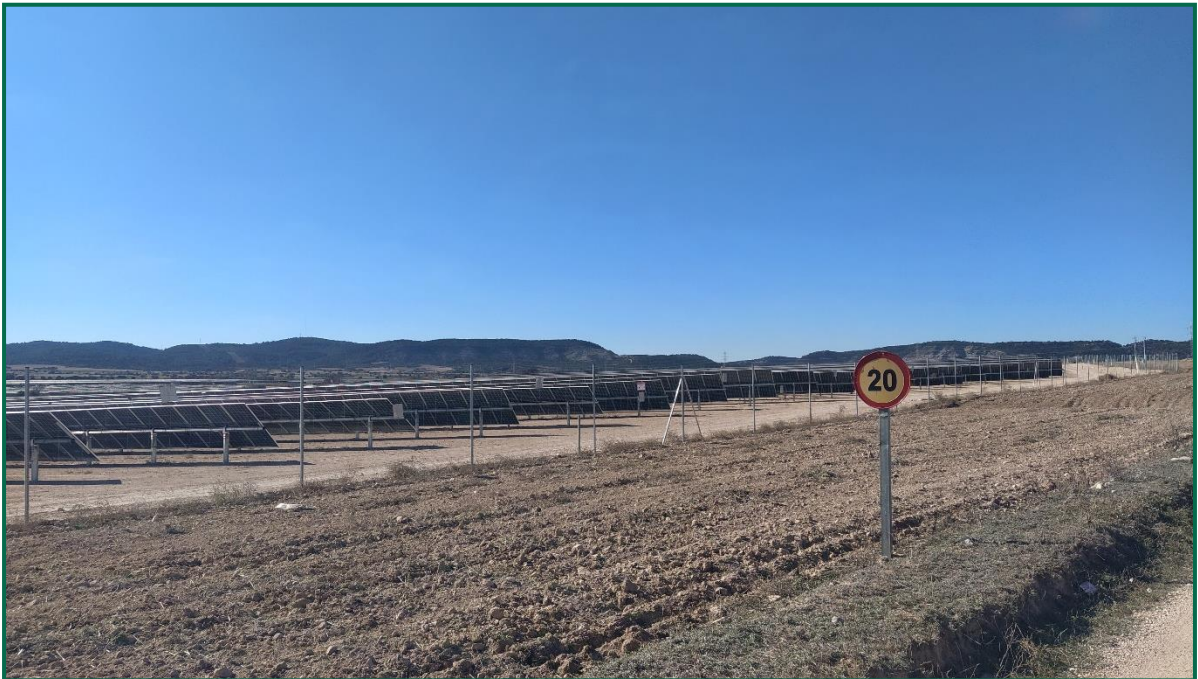
Fotografía 3. Señal de limitación de velocidad.