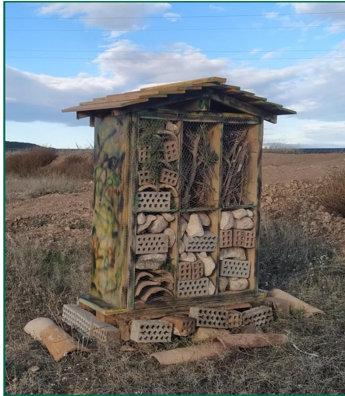
Fotografía 9. Hotel de insectos.