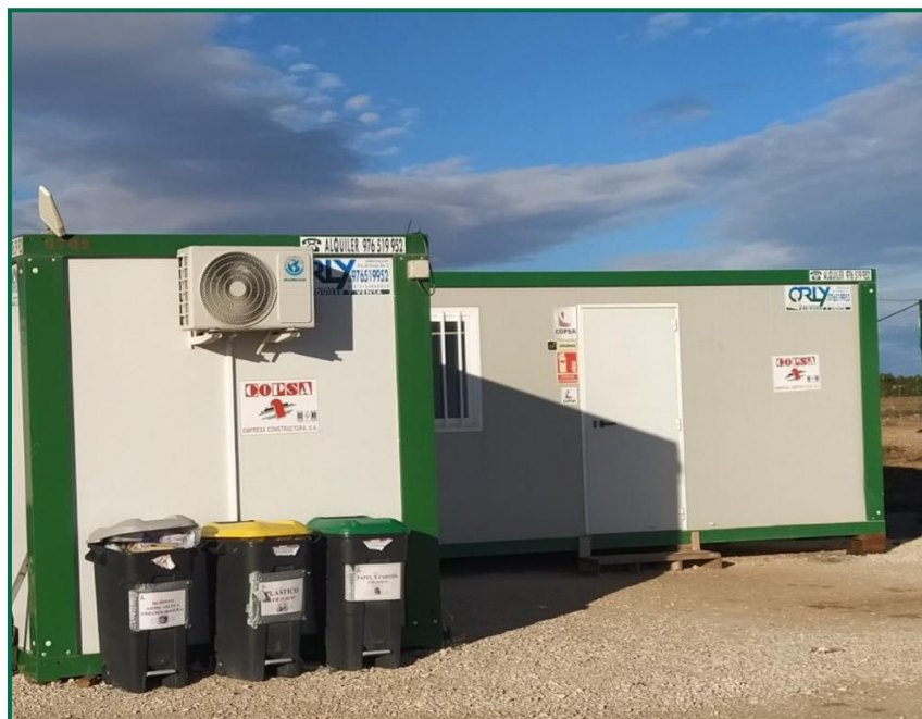
Fotografía 16. Cubos en el exterior de las oficinas.

Se han instalado contenedores de gran tamaño para plásticos, y para cartón, durante este mes se han realizado varias recogidas de los residuos que aún permanecían en la obra. En el exterior de las oficinas hay cubos para la separación de papel, envases y asimilable a urbana.