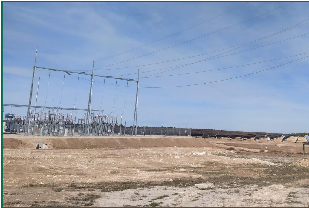
Fotografía 4. Tierra vegetal sobre talud.