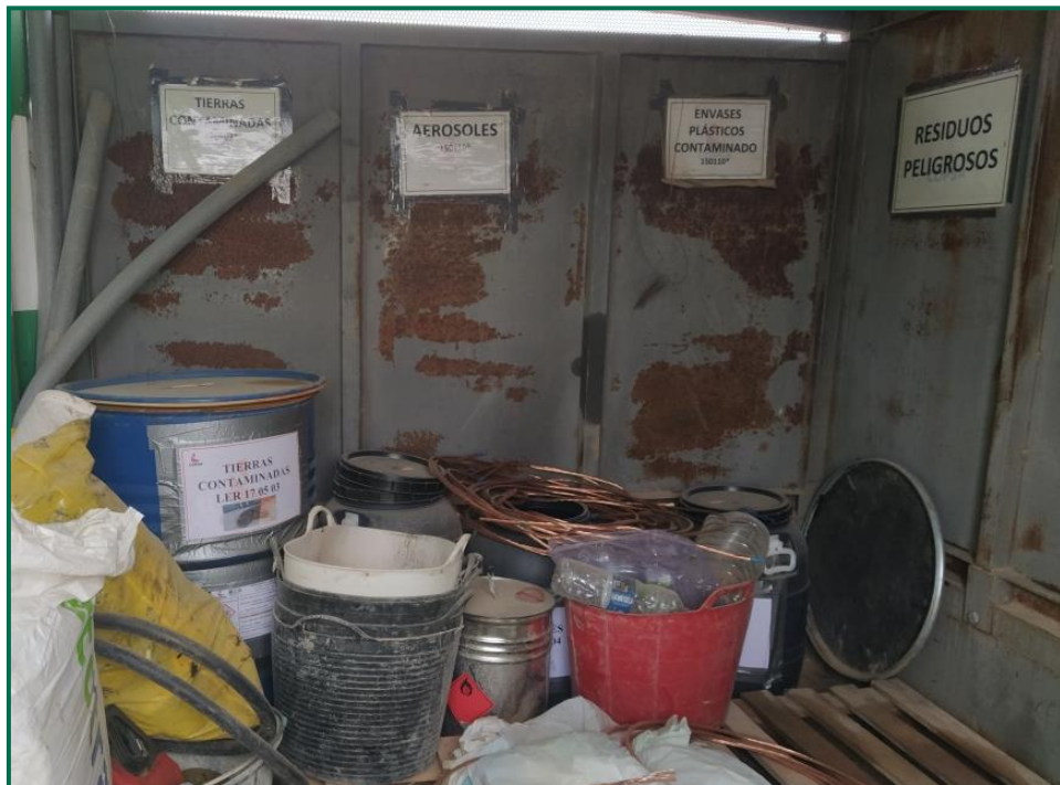
Fotografía 14. Contenedor residuos peligrosos.