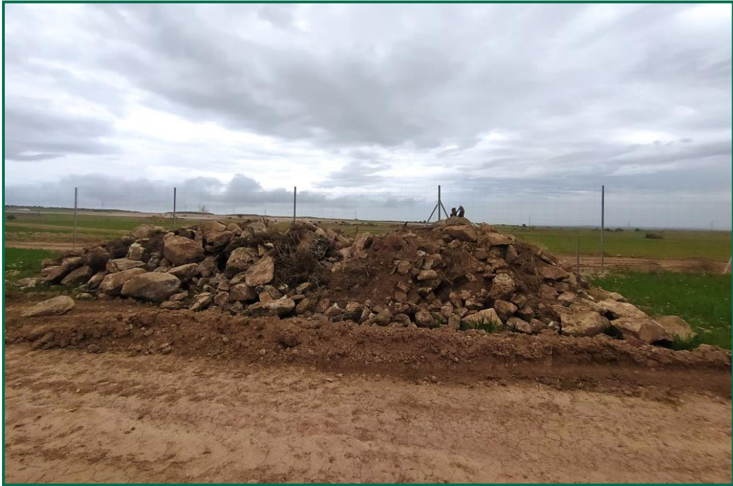
Fotografía 7. Majano para reptiles.