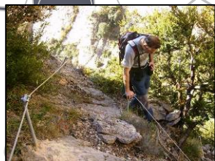
Bajada al barranco de San Martín de la Val d'Onsera

ATENCIÓN: Peligro de caídas al vacío. Pasos cercanos a laderas con fuerte pendiente y precipicios. EXTREME LA PRECAUCIÓN.