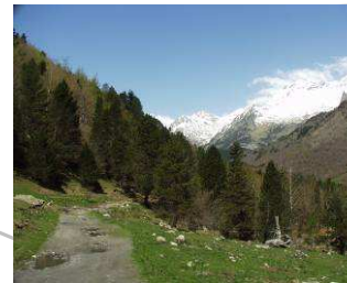
Valle de Estós

Este sendero transcurre en parte por el valle de Estós, un valle amplio, verde, salpicado de bosques y flanqueado por gigantes de más de 3.000 m que aportan grandiosidad a un paisaje muy armonioso en cualquier época del año. Concluye en el impresionante ibón de Escarpinosa, en cuyas aguas podemos ver reflejadas las magníficas agujas del Perramó.