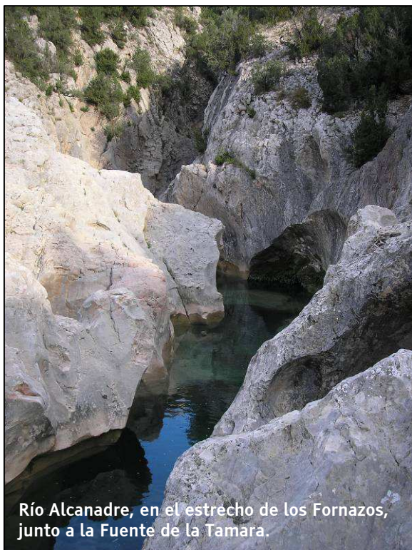
Río Alcanadre, en el estrecho de los Fornazos, junto a la Fuente de la Tamara.

Enlace con otros senderos: Desde la Fuente de la Tamara podemos tomar una senda que enlaza con el sendero S-2 Pacos de Morrano, en las proximidades de la Peña Falconera o Huevo de Morrano.