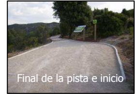
Final de la pista e inicio

Recorrido: El sendero comienza en la entrada del aparcamiento del salto de Bierge. La senda, que bordea por la derecha las instalaciones turísticas del salto, coincide durante el primer kilómetro con una pista forestal que da acceso a diferentes campos y fincas privadas. Esta pista es de acceso restringido, solo permitiéndose el paso a propietarios y a personas con discapacidad, que puede estacionar su vehículo en la plaza de aparcamiento acondicionada y que se encuentra al final de la pista.