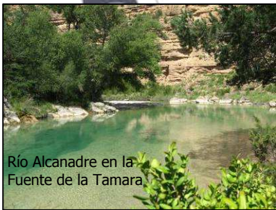
Río Alcanadre en la Fuente de la Tamara

Se trata de un itinerario sencillo y ameno que conduce al recóndito rincón del río Alcanadre conocido como Fuente de la Tamara, que constituye una importante surgencia situada junto a la salida del estrecho tramo denominado Los Fornazos (tramo habitual en descenso deportivo de barrancos). Es este tramo del río Alcanadre se pueden apreciar as diferencias del modelado fluvial sobre areniscas, conglomerados y calizas, en un ambiente forestal netamente mediterráneo.