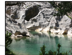
Río Alcanadre en la Fuente de la Tamara

ATENCIÓN: El sendero cruza el río en la Fuente de la Tamara. Hay que estar atentos al nivel del agua y a la fuerza de la corriente. EXTREME LA PRECAUCIÓN.