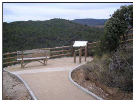
Mirador de Peña Falconera, fin del tramo accesible.