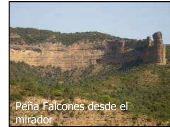
Peña Falcones desde el mirador

A partir de este punto, la senda se estrecha y durante los 400 primeros metros está acondicionada para el paso de sillas de ruedas y carritos de niño.