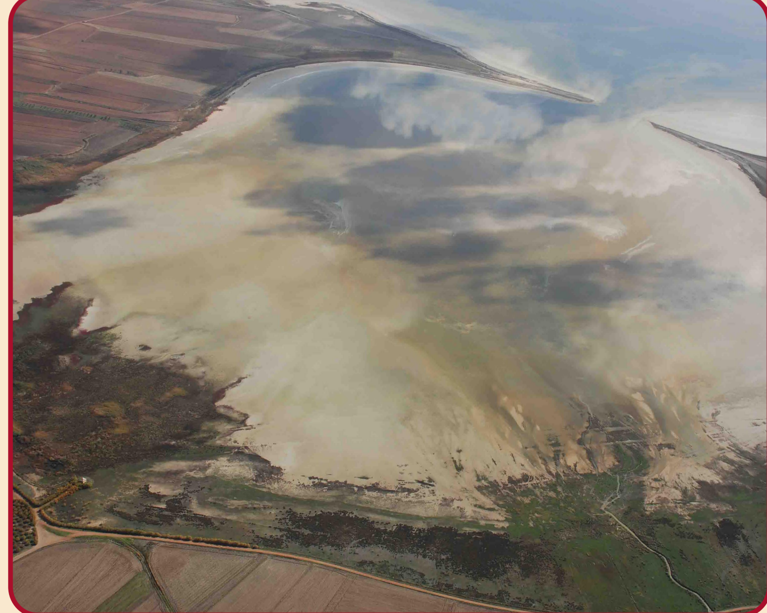
Vista aérea Lagunazo de Gallocanta y Los Picos

Recomendaciones: En primavera y verano es aconsejable disponer de agua y sombrero, y en otoño e invierno es aconsejable llevar agua y ropa de abrigo. En época de lluvias hay que evitar transitar por zonas encharcadas para evitar atascos. Para la observación de aves se recomienda el uso de prismáticos. Extremar la precaución cuando se transite por la carretera.