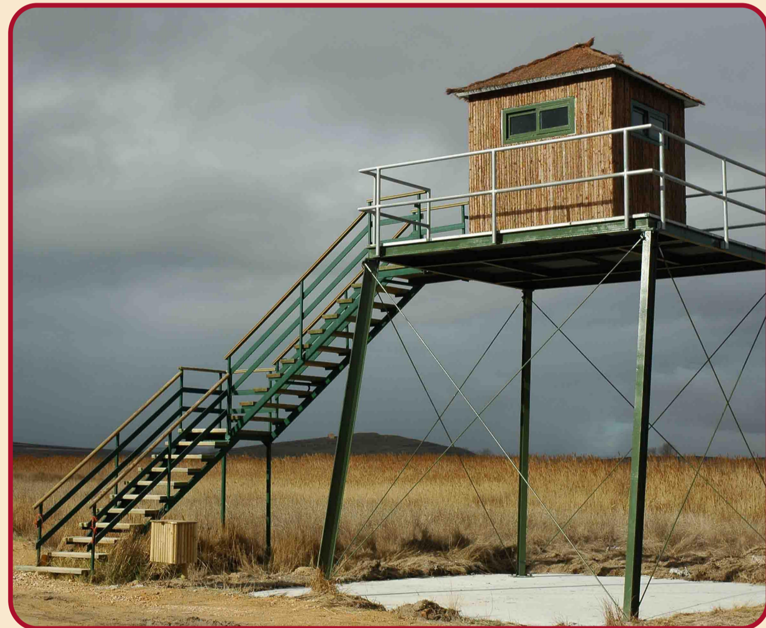
Torre Observatorio La Reguera

Recorrido: Comienza a 2 km del Centro de Interpretación de la Reserva Natural de la Laguna de Gallocanta, dirección Tornos, y termina en el propio Centro de Interpretación. Permite rodear la laguna a una distancia prudencial, perturbando lo mínimo posible el ecosistema. Por su longitud está pensado para ir en automóvil o en bicicleta, aunque se puede recorrer a pie. Es muy llano y aunque atraviesa principalmente campos agrícolas, en algunos tramos se acerca a los prados salinos y playas de la laguna. El sendero va por pistas de tierra a excepción del último tramo que coincide con la carretera que une Bello y Tornos, y un pequeño tramo cerca de la localidad de Gallocanta. Durante el recorrido podemos acceder a seis observatorios que nos permitirán, desde una posición privilegiada, la observación de las aves. Otra parada interesante es la Ermita de la Virgen del Buen Acuerdo desde donde tendremos una visión más amplia de la Laguna de Gallocanta, ya que se encuentra en una zona elevada. Si nos desviamos del sendero podemos acceder al Castillo de Berrueco con una vista espectacular de la Cuenca de la Laguna.