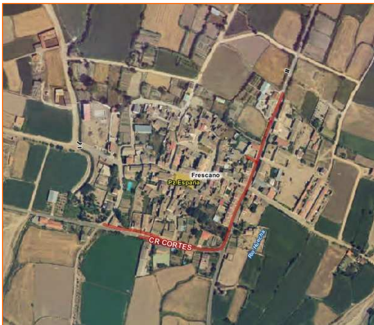
Ortoimagen de los límites de la zona urbana de Fréscano.