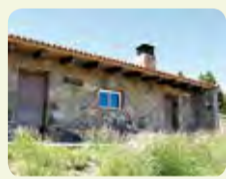
Refugio Majada Baja

El Parque Natural dispone de 4 refugios no guardados, que cuentan con mesa picnic, chimenea y lugar de refugio.