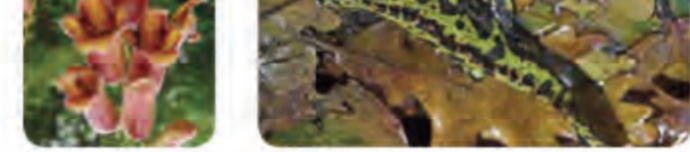
Trítón jaspeado ( Triturus marmoratus ).