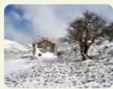
Refugio Collado del Campo