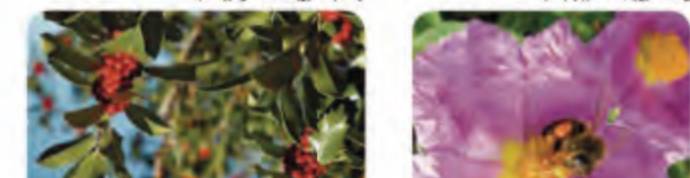
Yara ( Cistus albidus ).