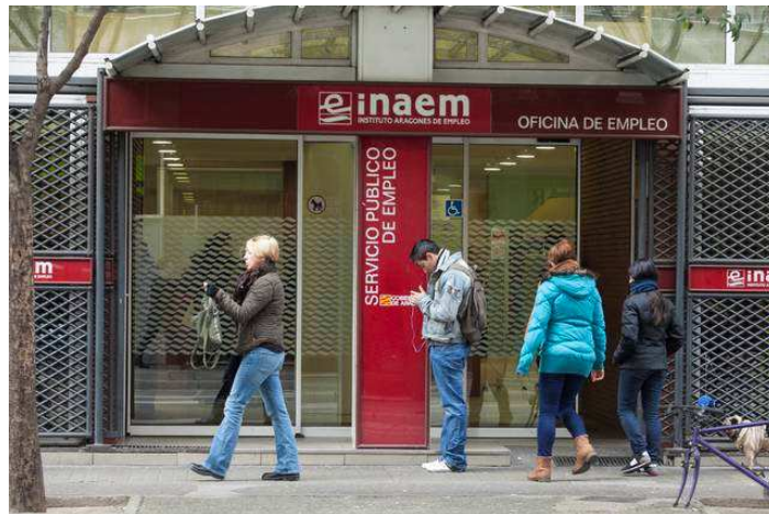
Varias personas, en la puerta de una oficina del Inaem en Zaragoza.