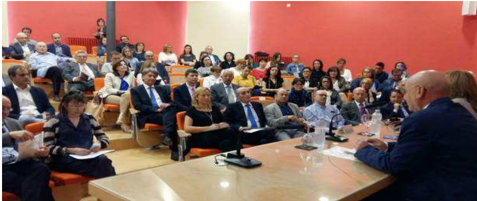
Presentación del informe del CESA sobre la situación de Aragón en 2016 (GOBIERNO DE ARAGÓN)