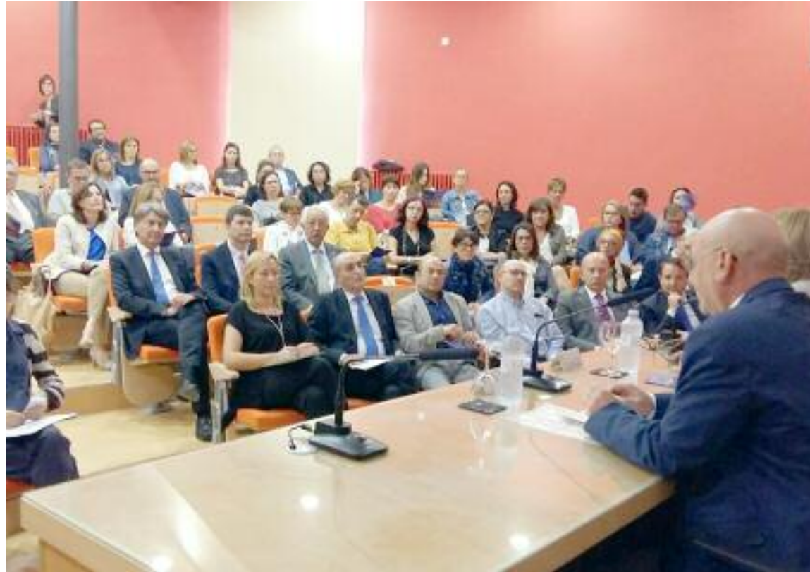
Un momento de la presentación del Informe del Consejo Económico y Social sobre el año 2016

En el 2016 se incorporaron nuevos trabajadores, algo que no ocurría desde 2008, según los datos del CESA