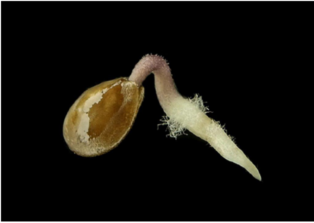
Detalle de semilla y radícula