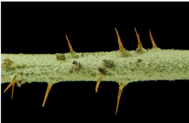
Detalle de espinas