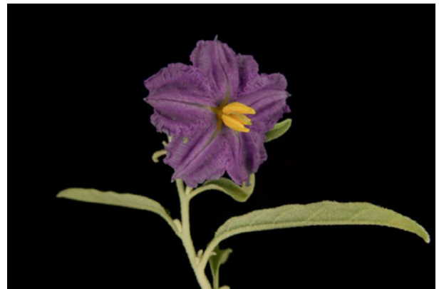
Detalle de flor morada

Autores: J. Pueyo (1), A.I. Marí (1), A. Cirujeda (1), G. Pardo (1), J. Aibar (2), A.M a . Aguado (3)