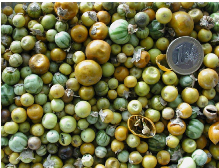
Frutos en diferentes estados de maduración

Los frutos son apetecibles para las ovejas y las semillas no pierden viabilidad en su tracto intestinal, por lo que se cree que el pastoreo es la principal fuente de dispersión esta planta ya que los focos más importantes se encuentran en zonas de paso de ganado ovino. También los movimientos de tierra llevados a cabo con motivo de la Expo 2008 y la construcción de diversas carreteras han favorecido la distribución de esta especie. Otra vía de dispersión son las escorrentías , ya que favorecen el movimiento de frutos , los cuales pueden flotar en la lámina de agua, sobre todo cuando están secos.