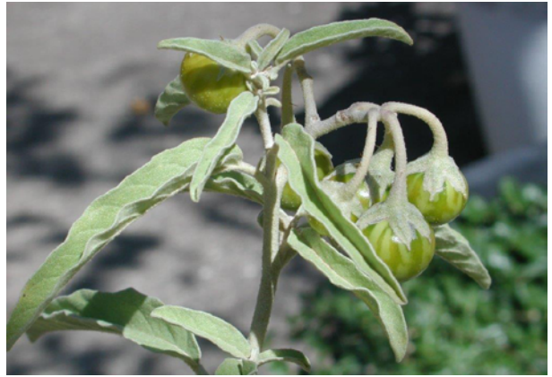
Detalle de la fructificación