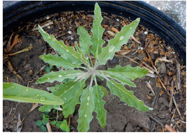
Planta en crecimiento