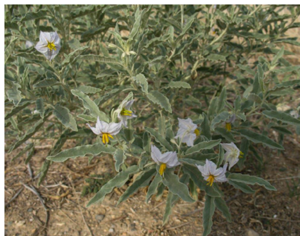
Detalle: Planta de flor blanca