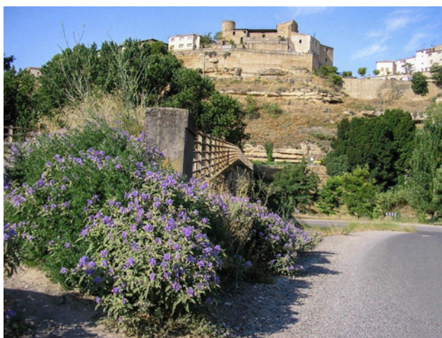
Planta en floración en una cuneta

Según la bibliografía, el uso de herbicidas sistémicos (glifosato o glifosato+2.4-D o de triclopir+fluroxipir) es la forma más adecuada para su control ya que penetra hasta las raíces de las plantas. Algunos de los rodales que hemos intentado controlar están situados en zonas de aceras, en las que los equipos de jardinería urbana realizan siegas periódicas. A pesar de las repetidas siegas y aplicación de herbicidas en lugares autorizados en muchos rodales siguen brotando algunas plantas, por lo que se debe tener en cuenta la resistencia y tenacidad de esta especie. Se recomienda realizar una labor profunda (sin triturar) en otoño que saque a la superficie los rizomas y permanezcan a la intemperie durante el invierno para que se sequen. Cuando rebroten en verano se realizará un tratamiento herbicida y, al menos, otro a finales de temporada para impedir que la planta acumule reservas y genere frutos.