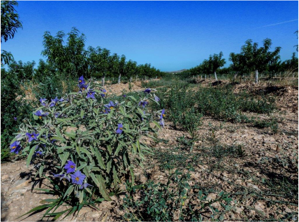
Planta con flor morada