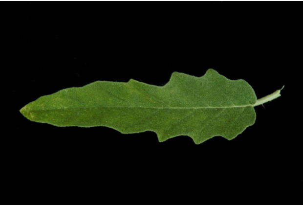
Detalle de hoja