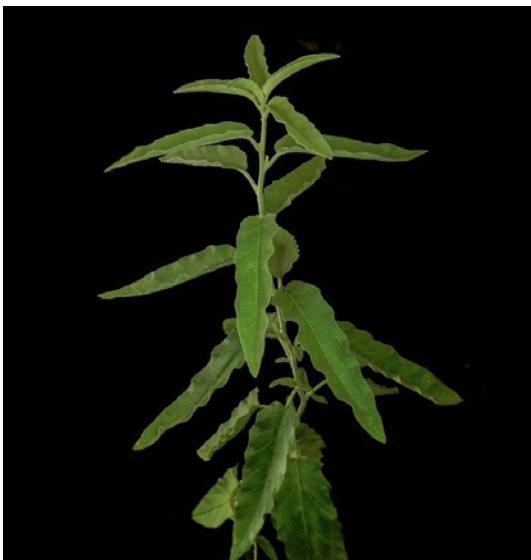
Planta en crecimiento