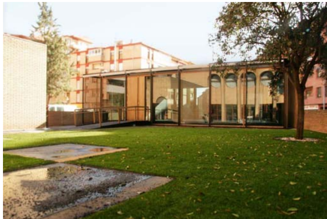
Ampliación del Centro en el año 2009

llegaron a las Comunidades Autónomas los Hogares del Jubilado dependientes del entonces Instituto Nacional de Servicios Sociales, (INSERSO).