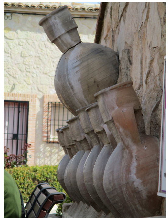
Alfarería en Mota del Cuervo

Regresamos de este bonito viaje por la misma ruta, dándome cuenta de que he disfrutado mucho del agua y las vías fluviales y con la sensación de que, como siempre, volveremos.