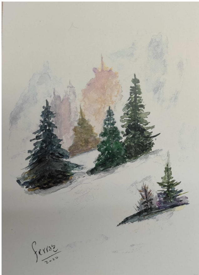
Acuarela pintada por José A. Ferraz

La nieve, que ha llegado a nuestros montes, nos ilusiona como niños mayores que somos.