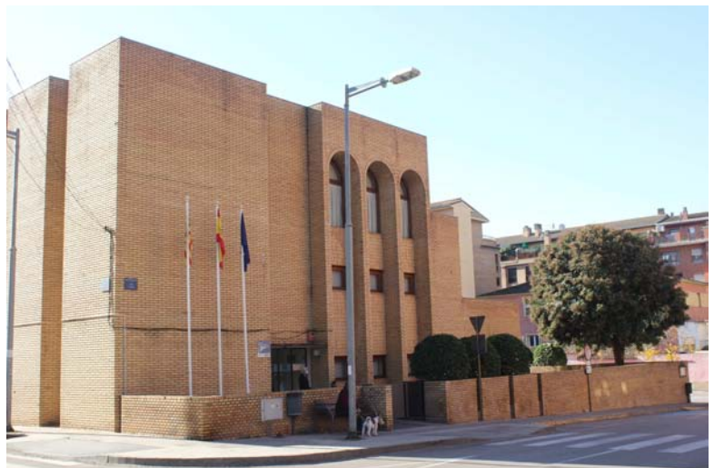
Fachada principal del Hogar