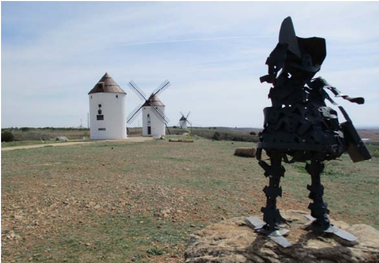
La Mancha, Quijote y molinos

llanura manchega, de historia interesante. En su plaza mayor, un hermoso edificio renacentista es Casa Consistorial. Y casi al lado la Parroquia de Santiago Apóstol, ambos Bien de Interés Cultural. En su interior una bellísima cruz de alabastro con una curiosa historia. Al lado entramos en un interesante museo de belenes, algunos italianos y, en la Torre Nueva vemos el museo etnográfico. Enfrente el enorme palacio del Marqués Valdeguerrero, habitado en alguna época del año.