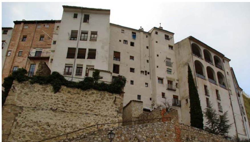
Rascacielos en Cuenca

El segundo día iniciamos la marcha en autobús y rodeamos Cuenca por la carretera del sur, que bordea la orilla izquierda del río Huecar, para llegar a la parte más alta de la ciudad, Patrimonio de la Humanidad. Hace fresquito y desde el castillo vamos descendiendo, a la derecha