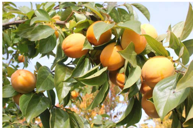
Caquis o palosantos

Tras un verano poco lluvioso en el Somontano de Barbastro con un clima muy caluroso y prolongado, mucho más allá del 15 (Virgen de Agosto) que, antiguamente era cuando llegaban los primeros truenos y con las tormentas ya empezaba a refrescar por la noche, el tiempo cambiaba y teníamos que proteger algunas plantas con el fin de recoger las semillas para guardar. Si bien en la tierra llana ha llovido sólo