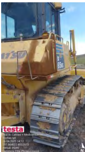
Posible derrame de repostaje