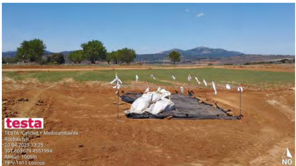
Tierras contaminadas anteriormente , a la espera de su recogida.