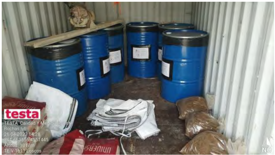
Almacén de residuos