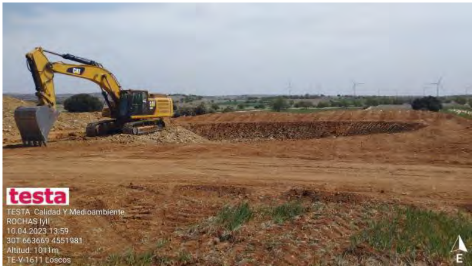
Separación de tierras

testa TESTA Calidad Y Medioambiente ROCHAS IyJI 10.04.2023 13:59 30T 663669 4551981 Altitud: 1011m TE-V-1611 Loscos