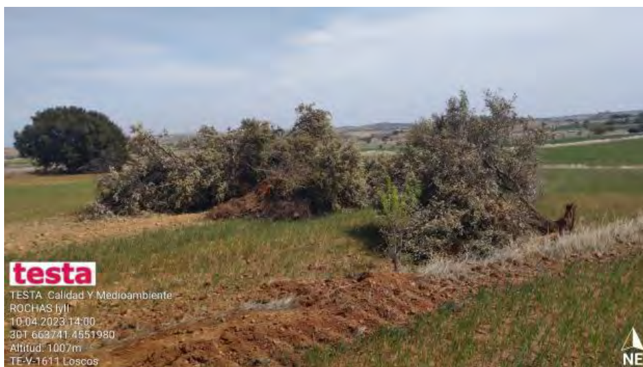
Separación de restos vegetales para su aprovechamiento