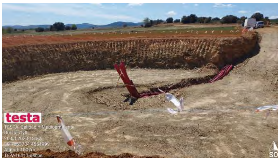
Avances en excavaciones