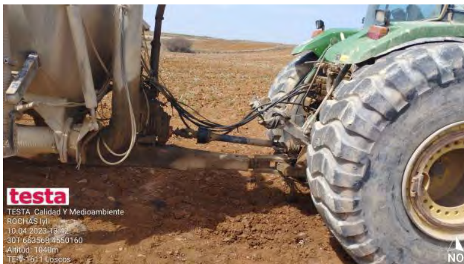
Manchas de aceite