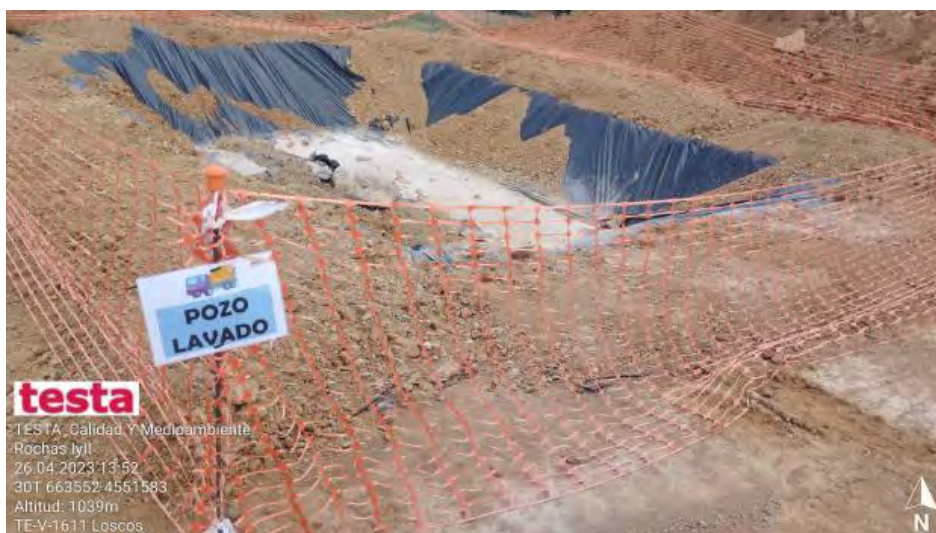
Pozo de lavado