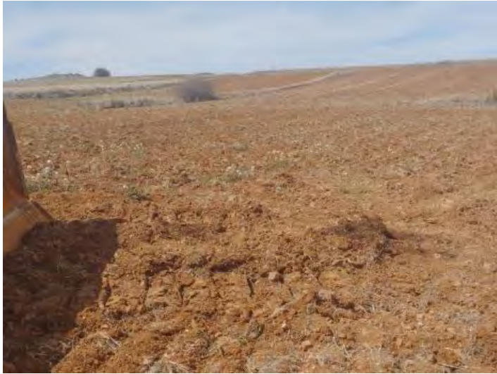
Antigua mancha de aceite