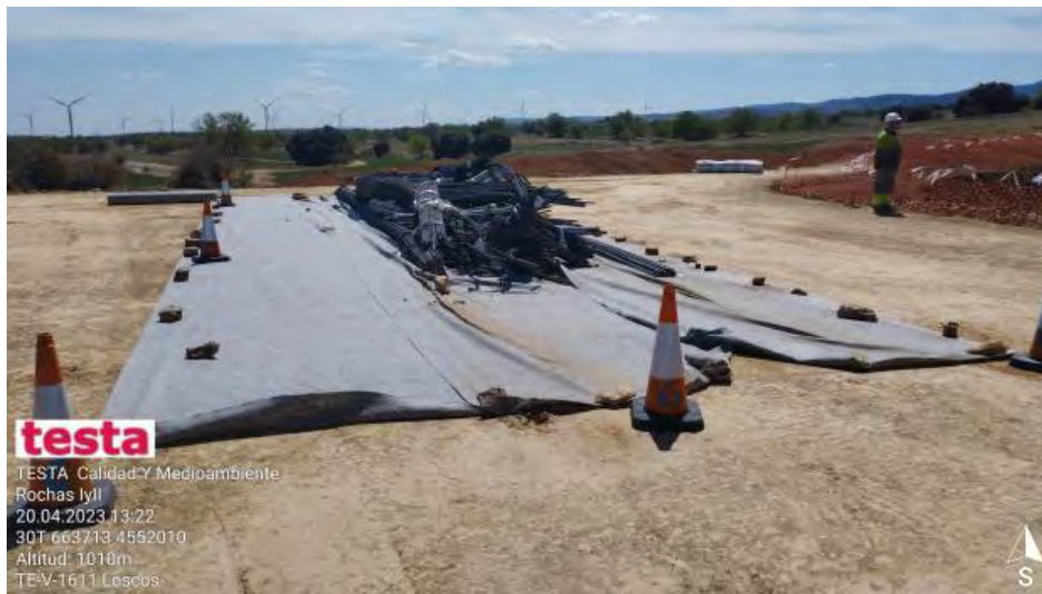
Acopio de hierros zapata.