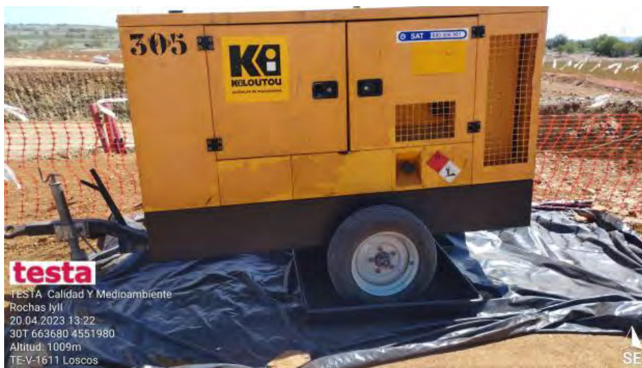
Maquinaria con bandejas