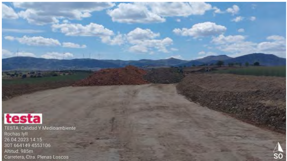
Acopio de tierras