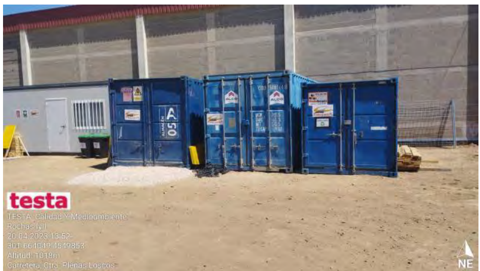
Contenedor residuos peligrosos