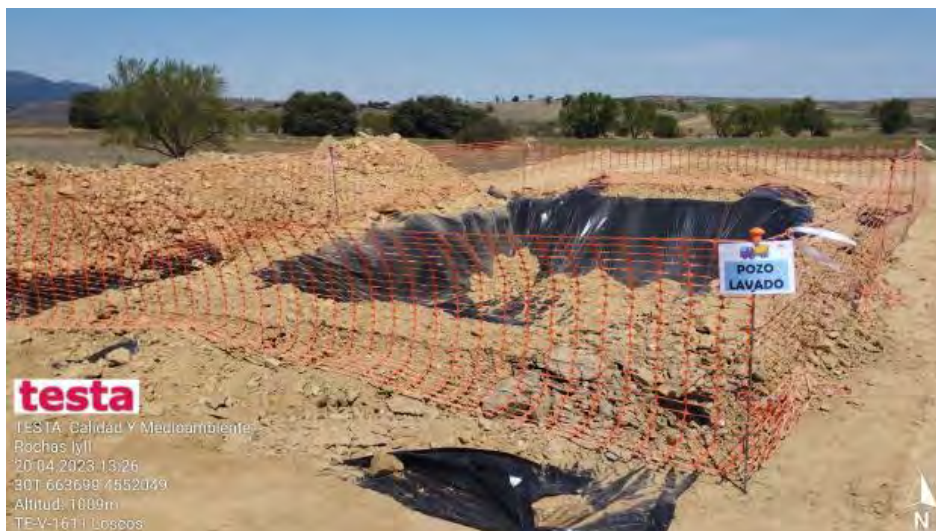
Pozo de lavado

testa TESTA: Calidad Y Medioambiente Rochas 1711 20/04/2023 13:26 30T 663699 4552049 Altitud: 1089m TE-V-1611 Loscos