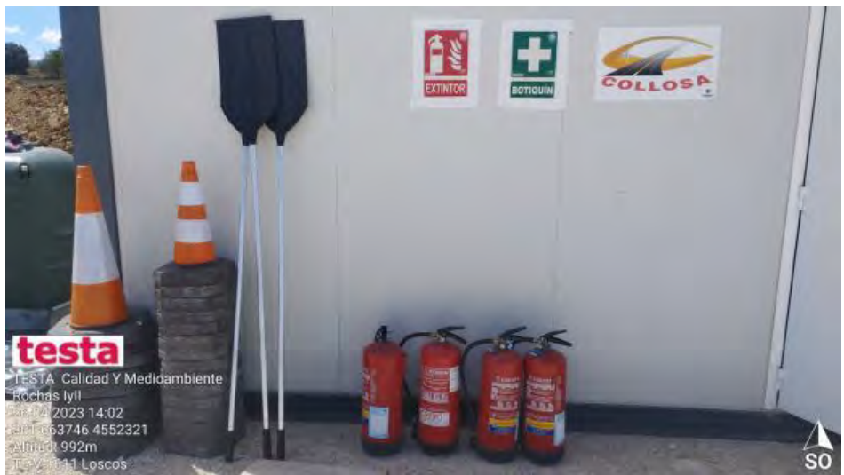
Material contra incendios